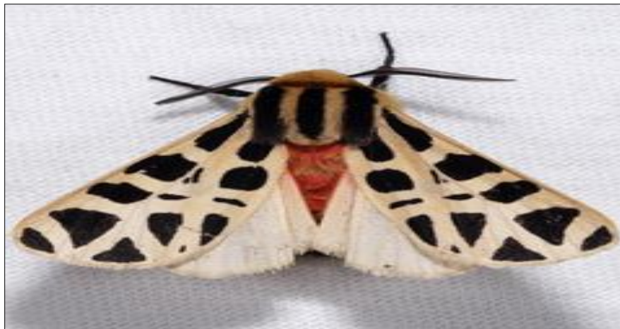
Figura 3. Polilla Tigre Mexicana ( Apantesis proxima ) Imagen tomada de McDonald (s.f.).

A nivel internacional algunos países de América Latina, como Perú, llevan a cabo proyectos de reforestación de bosques utilizando abejas nativas sin aguijón. Este proyecto mezcla la producción de miel con la restauración de ecosistemas, privilegiando las prácticas comunitarias para la preservación de los insectos polinizadores y su hábitat; en México el aumento en el cultivo del agave ha llevado a los murciélagos polinizadores a disminuir su población; por lo que en Zinacantán, Chiapas tratan de mitigar las consecuencias desarrollando un programa de cultivo sostenible del agave y la preparación de lugares específicos de alimentación para los murciélagos.