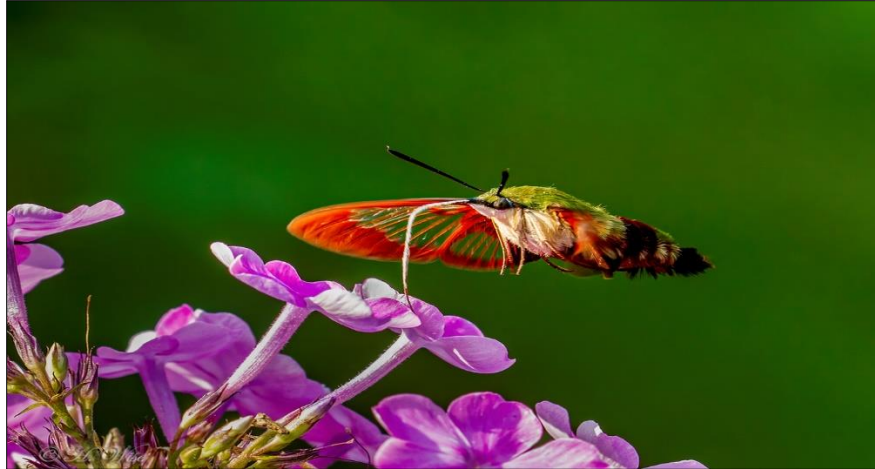
Figura 2. Polilla Esfinge Abejorro Colibrí ( Hemaris thysbe )