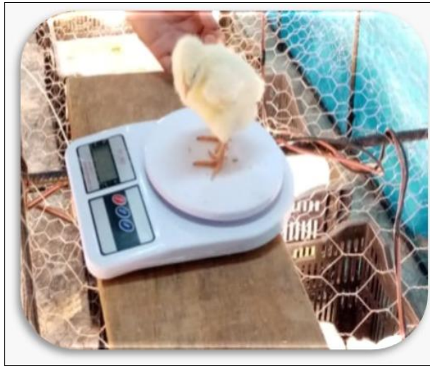
Figura 3. Polluelo de la línea Cobb 500 al inicio de la engorda.

La figura 1 permitió observar las tres etapas de la producción (Rebollar Rebollar et al., 2023) de pollos de engorda. En la etapa I las aves presentaron rendimientos (incremento del peso in vivo ) marginales crecientes; mientras que en la II (etapa rentable) los incrementos marginales de peso de las aves fueron decrecientes pero positivos hasta el punto en el que la pendiente de la función es cero (límite de la etapa II) con un nivel de uso del insumo variable de 9.90; después de ese nivel de consumo de alimento acumulado, la tasa ganancia del peso fue decreciente y negativa (rendimientos marginales decrecientes y negativos).