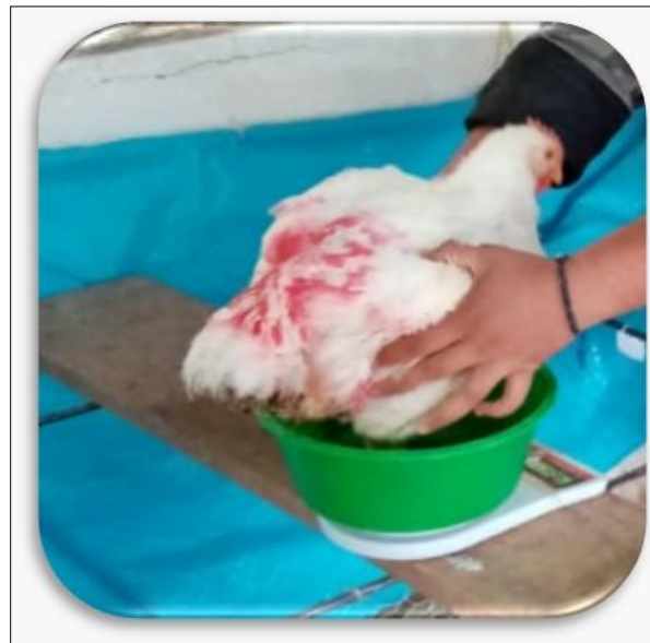
Figura 4. Pollo de engorda línea Cobb 500 en crecimiento.

La figura 1 permitió observar las tres etapas de la producción (Rebollar Rebollar et al., 2023) de pollos de engorda. En la etapa I las aves presentaron rendimientos (incremento del peso in vivo ) marginales crecientes; mientras que en la II (etapa rentable) los incrementos marginales de peso de las aves fueron decrecientes pero positivos hasta el punto en el que la pendiente de la función es cero (límite de la etapa II) con un nivel de uso del insumo variable de 9.90; después de ese nivel de consumo de alimento acumulado, la tasa ganancia del peso fue decreciente y negativa (rendimientos marginales decrecientes y negativos).