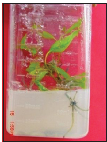
Figura 4. Respuesta obtenida con los tratamientos para la enraizamiento, en donde se aprecia el vigor de la planta y el desarrollo de raíces.

Para la producción de raíces, con 1 mg L -1 de AIB los explantes desarrollaron raíces y una vez que eran transferidos a medio basal, éstas se desarrollaban rápidamente favoreciendo el crecimiento de la planta (figura 4).