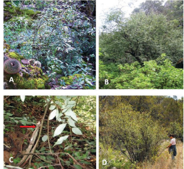
Figura 1. Aspectos de las poblaciones de laurel silvestre estudiadas. A) Ejemplares de porte arbustivo en Sierra Fria, Ags.; B) ejemplar de porte arboreo en la Sierra de Laurel, Ags.; C) señales de colecta ilegal (flecha) en una planta de laurel silvestre en la Sierra de Laurel, Ags.; d) población de laurel silvestre en buen estado de conservación en la Estación Biológica "Agua Zarca" de la UAA.

Los primeros experimentos se llevaron a cabo utilizando tallos colectados directamente de plantas del campo, los cuales presentaron un alto índice de contaminación y/o necrosis por oxidación. Estos explantes, tratados con 0.5 mg/L -1 de BA todos, se necrosaron de la base y murieron a los pocos días (figura 2A). Con 1 mg/L -1 de BA los explantes desarrollaron tejido calloso en la base que eventualmente se oxidó y necrosó junto con la parte aérea (figura 2B). Con 0.25 mg L -1 de ANA, se obtuvo una mayor producción de tejido