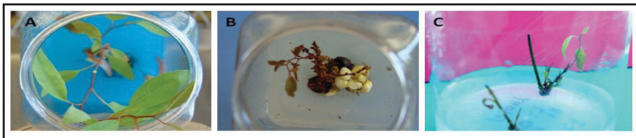
Figura 3. Respuesta obtenida con los tratamientos para la germinación de meristemos preexistentes con explantes obtenidos de semillas germinadas in vitro : (A) con 0.5 mg/L de BA; (B) con 1 mg/L de BA; y (C) con 1 y 0.25 mg/L de BA y ANA, respectivamente.

Otra fuente de explantes fueron los tallos de plántulas germinadas in vitro , las cuales sí mostraron respuesta positiva ante los diferentes tratamientos evaluados (figura 3). Con 0.5 mg/L -1 de BA desarrollaron pocos brotes, pero se elongaron rápidamente y generaron muchos entrenudos que fueron utilizados para los experimentos de propagación (figura 3A). Con 1 mg/L -1 de BA se obtuvo una proliferación más abundante, pero con tejido calloso en la base de los explantes, mismo que eventualmente desarrolló embriones somáticos que posteriormente se necrosaron (figura 3B). La adición de ANA en el medio de cultivo favoreció la brotación de los meristemos preexistentes (figura 3C).