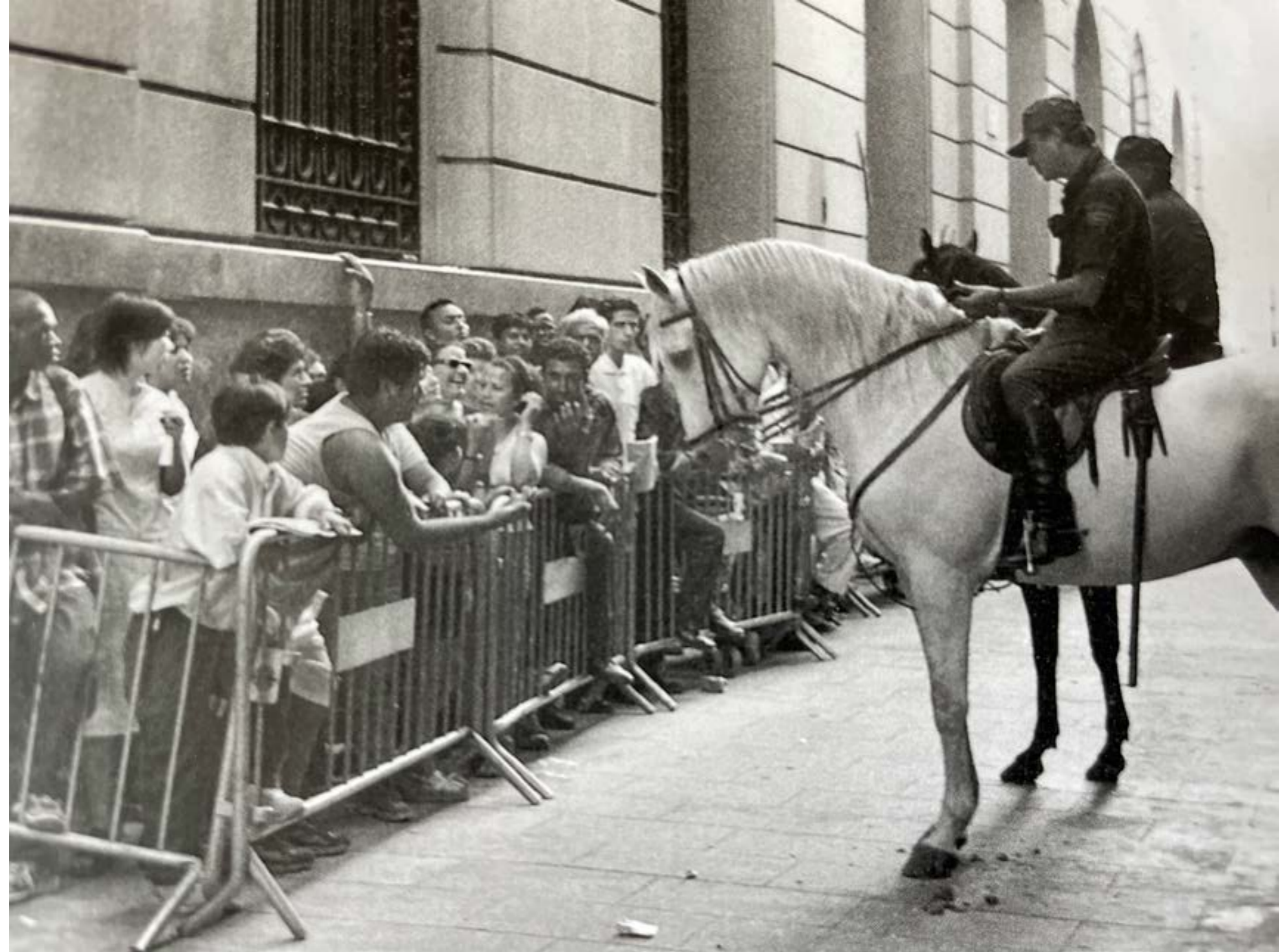
Guerrero, J. 2014. Policías a caballo controlan colas de inmigración . [Fotografía] Utilizada con el consentimiento de Joan Guerrero, dueño de los derechos de autor de la imagen. | Fotografía publicada originalmente en: Andújar, J. P. (2014). Milagro en Barcelona: emigrantes hoy, porque emigrante soy . Barcelona: Editorial Ariel. [página 44]

Y así es como, desde el desconocimiento y la desconfianza, se crean la frustración, la segregación y, con frecuencia, cosas peores. Pienso nuevamente en las novelas de Cotzee, en La edad de hierro , por ejemplo, en los blancos de Sudáfrica viviendo en sus urbanizaciones de lujo, vigiladas por la policía, en los condominios fechados de Brasil, en los barrios caros de Ciudad de Guatemala, rodeados por sus respectivos controles de seguridad privada, ciudades dentro de otras ciudades. Y pienso ¿quién es el que está realmente encerrado?