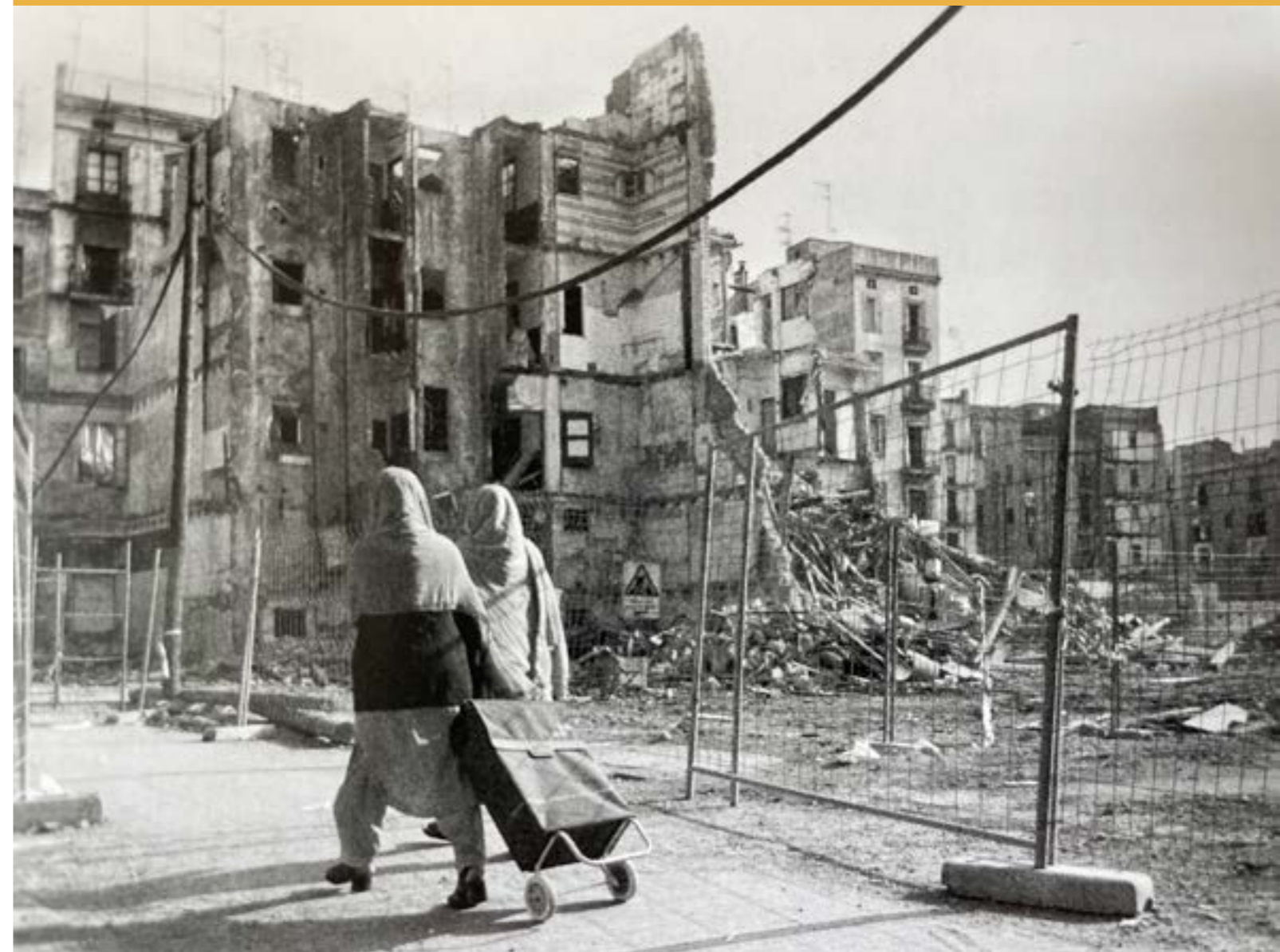
Guerrero, J. 2014. Mujeres inmigrantes cruzan frente a un barrio en renovación. [Fotografía] Utilizada con el consentimiento de Joan Guerrero, dueño de los derechos de autor de la imagen. | Fotografía publicada originalmente en: Andújar, J. P. (2014). Milagro en Barcelona: emigrantes hoy, porque emigrante soy. Barcelona: Editorial Ariel. [página 48]

a la condición humana. Me habla de personas que, ya sea con apoyo oficial o mediante un ahorro riguroso, han logrado abandonar los bloques de viviendas y adquirir una segunda residencia o una casa más amplia. Lo que hacen es alquilar sus antiguos apartamentos a emigrantes que los utilizan como viviendas superpobladas, creando así una dinámica en la que antiguos emigrantes explotan a los nuevos pobres, perpetuando un círculo vicioso. Son como los feudos de los Albiol y otros. Esto me hace reflexionar sobre las madames que alguna vez fueron trabajadoras sexuales en su juventud y que, en lugar de tratar de rescatar a las jóvenes de las redes de la mafia, buscan beneficiarse del esfuerzo de las pupilas a las que supuestamente protegen.