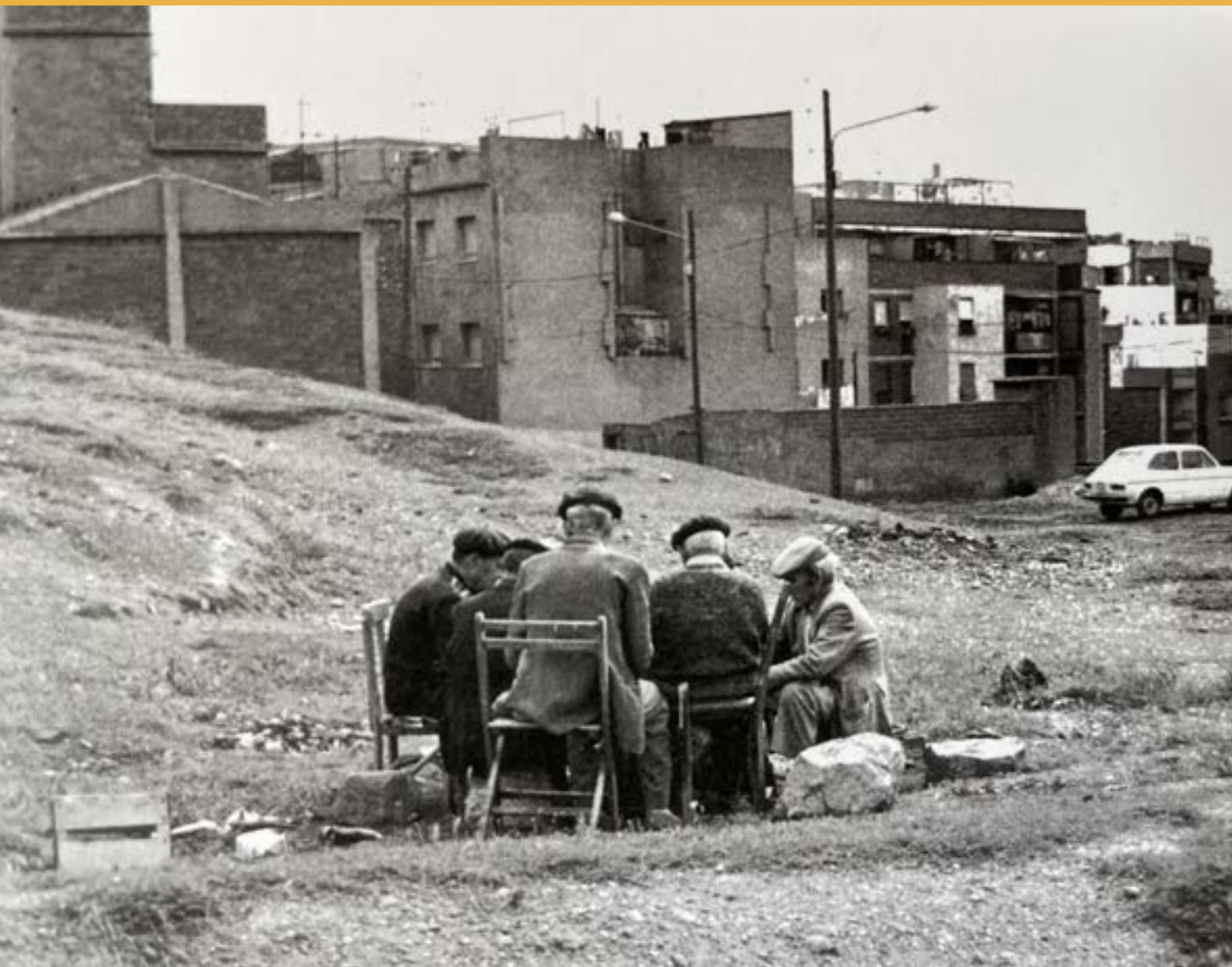
Guerrero, J. 2014. Echando las partidas en un descampado. [Fotografía] Utilizada con el consentimiento de Joan Guerrero, dueño de los derechos de autor de la imagen. | Fotografía publicada originalmente en: Andújar, J. P. (2014). Milagro en Barcelona: emigrantes hoy, porque emigrante soy. Barcelona: Editorial Ariel. [página 15]

Cuando llegó el momento de encontrar su propio piso, optó por buscarlo cerca del parque del Clot. Quería un lugar que le permitiera caminar hasta la casa de su madre y llegar al centro de la ciudad para comprar libros. Le mencionó que, durante mi tiempo en el Ayuntamiento, en el que trabajé en el Departamento de Urbanismo durante tres años a fines de los años ochenta, se comprobó que al tener playas limpias disponibles para el uso público y con las nuevas plazas en lugar de antiguas fábricas obsoletas, la gente empezó a depender menos de los coches. Esto no solo mejoraba la calidad de vida de la gente, sino que también mejoraba la movilidad.