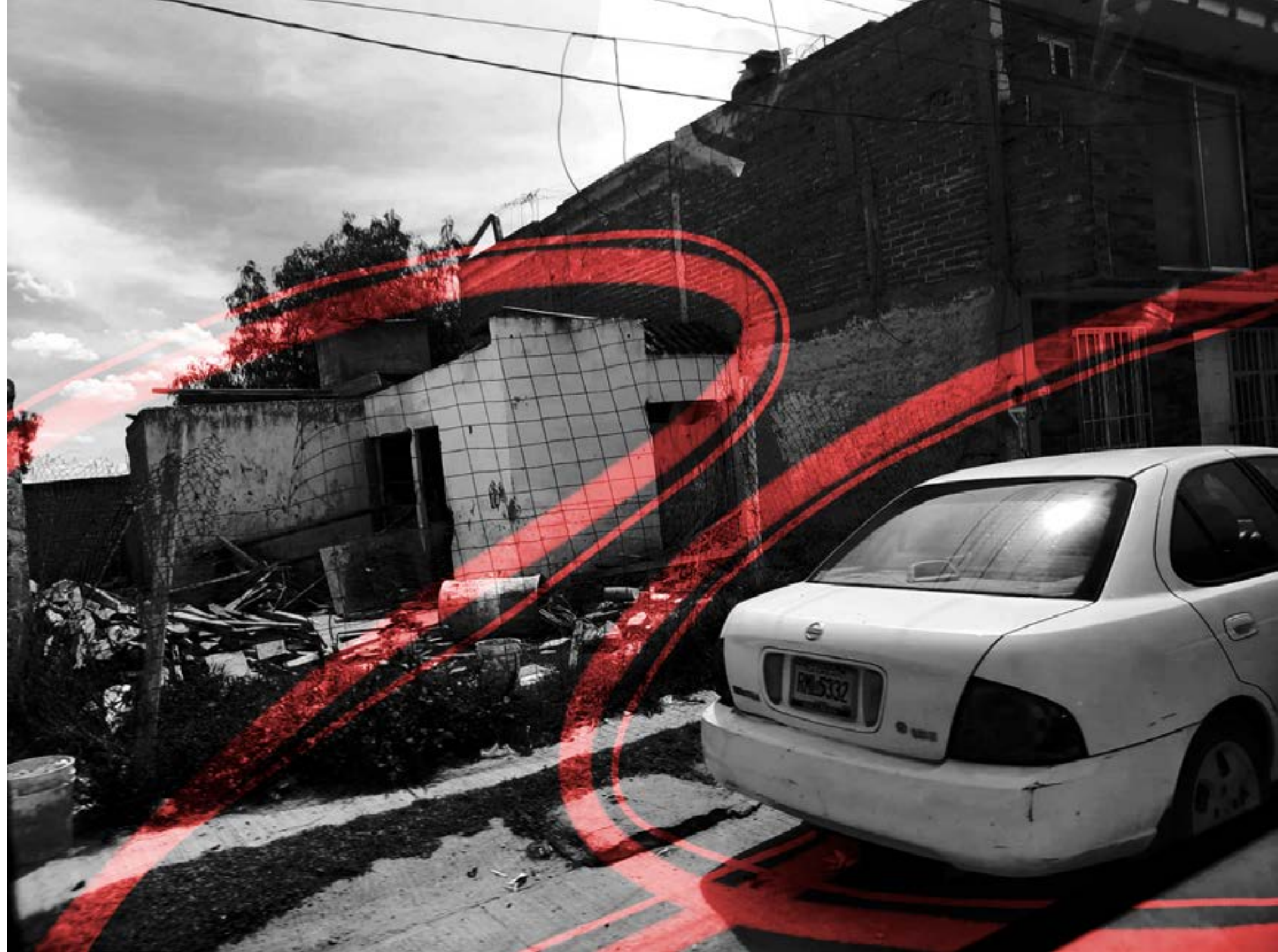
García, G. 2022. Deficiencia. Viviendas en malas condiciones que son habitadas por paracaidistas. [Fotografía]