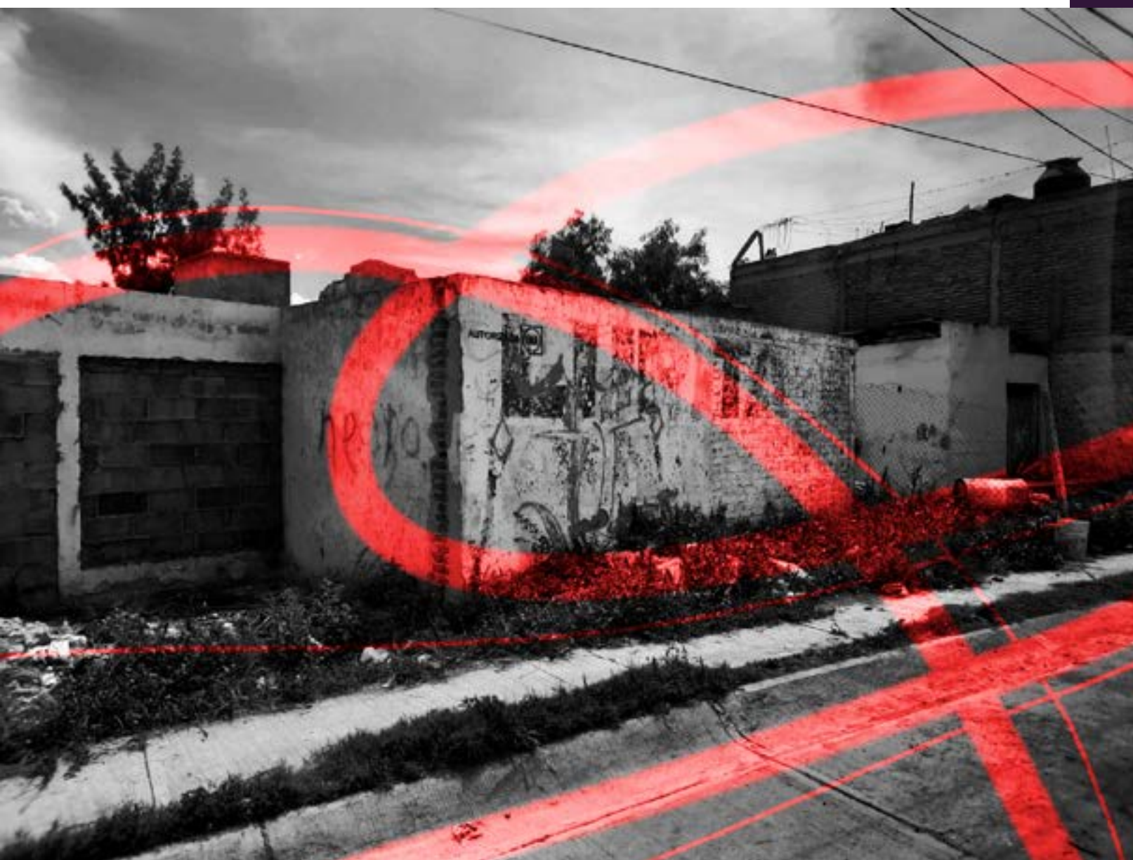
García, G. 2022. "Picadero". Zona de venta de drogas. [Fotografía]