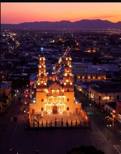
Quirván, A. 2020. Catedral de Aguascalientes. El principal edificio católico de la ciudad y uno de sus monumentos más emblemáticos. [Fotografía].