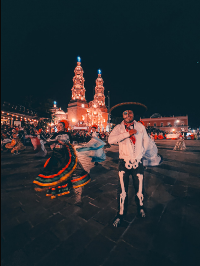
Quirván, A. 2022. Festival de Día de Muertos. El día 2 de noviembre se conmemora en México esta festividad y en Aguascalientes se lleva a cabo el Festival de Calaveras. [Fotografía].

Todos estamos inspirados por películas, series, libros, artículos, exposiciones e incluso la misma publicidad que nos llama la atención, así es como vamos formando nuestro estilo para generar contenido.