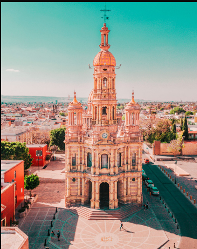
Quirván, A. 2021. Templo de San Antonio. El templo más bello de la ciudad se ubica en su centro histórico. Una obra del reconocido arquitecto autodidacta Refugio Reyes. [Fotografía].