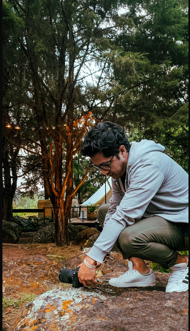
Quirván, A. 2021. Retrato 1. Zapotlanejo, Jalisco. [Fotografía].

Una vez leí en una exposición fotográfica una frase que me gusta muchísimo: “Nadie fotografía un tema que no esté dentro de sí”. La interpreto como a todo aquello que nos gusta, nos llama la atención y nos apasiona, es el motivo para encender nuestra cámara y producir una historia, ya sea estática (fotografía) o con movimiento (video).