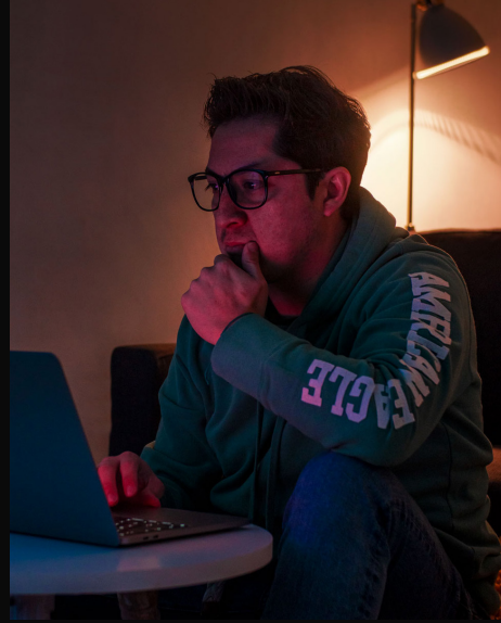
Quirván, A. 2021. Autorretrato 1. Aguascalientes, Proceso creativo. Aqs. [Fotografía].

Uno de mis hacks más comunes es ponerme a pensar como espectador, como alguien que consume contenido a diario, también como alguien que busca constantemente aprender narrativas, discursos y métodos de generación de contenido. Es de esta manera como en conjunto con las preguntas que busco responder, comienzo a generar ideas que disipen estas dudas que van acompañadas de una narrativa.