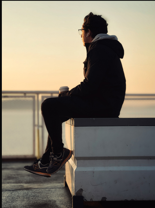
Quirván, A. 2022. Retrato 2. Vancouver. British Columbia, Canadá. [Fotografía].

Sin importar el municipio, el estado o el país, siempre me ha interesado comunicar una idea, una historia, el registro de un lugar, las anécdotas y, lo más importante, compartir la forma en cómo yo percibo ese lugar. Al tener más clara esa idea, analizo cuál sería la mejor forma de contarlo, una fotografía, un reel, etc., y finalmente, comienzo con la magia.