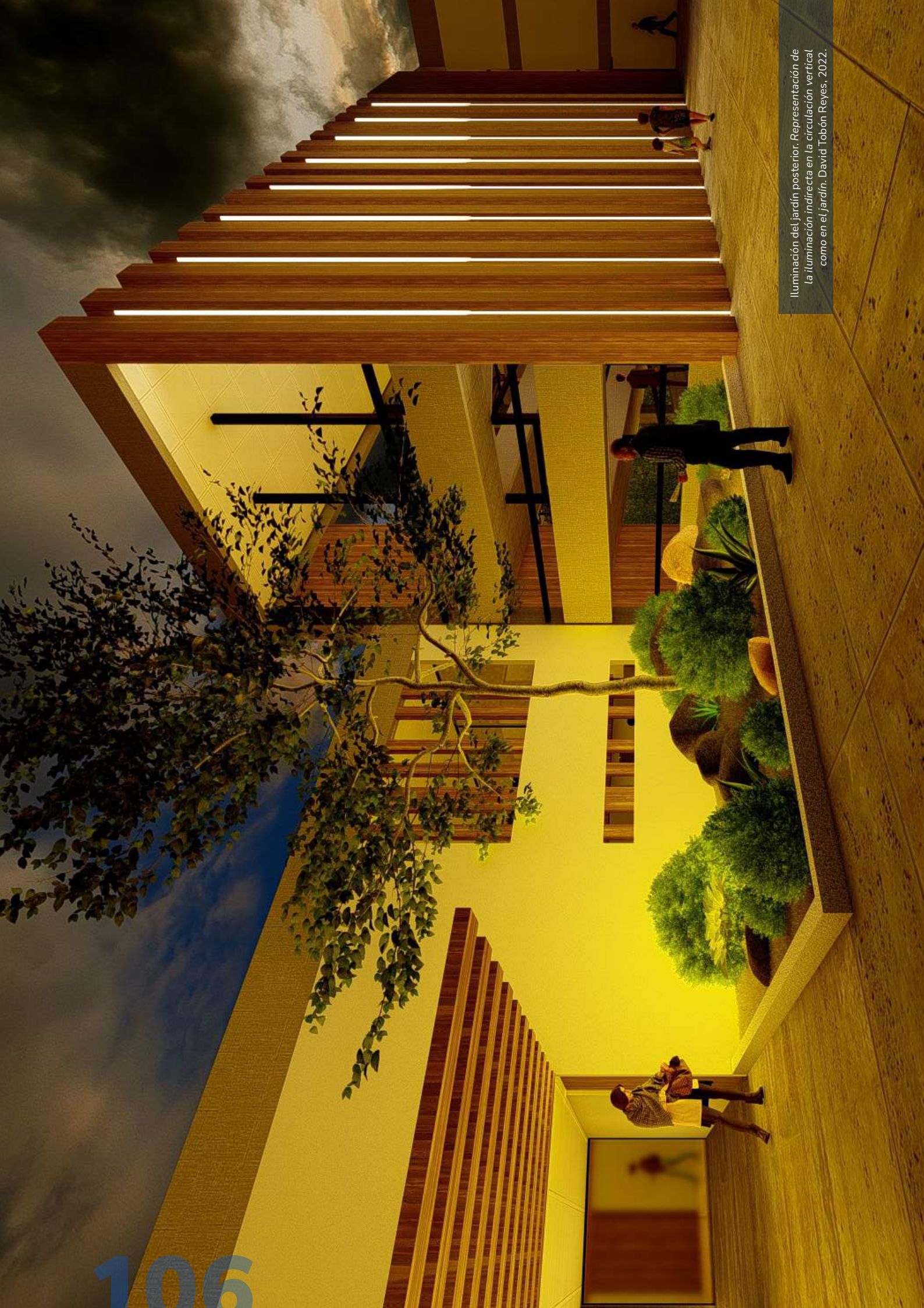
Iluminación del jardín posterior. Representación de la iluminación indirecta en la circulación vertical como en el jardín. David Tobón Reyes, 2022.