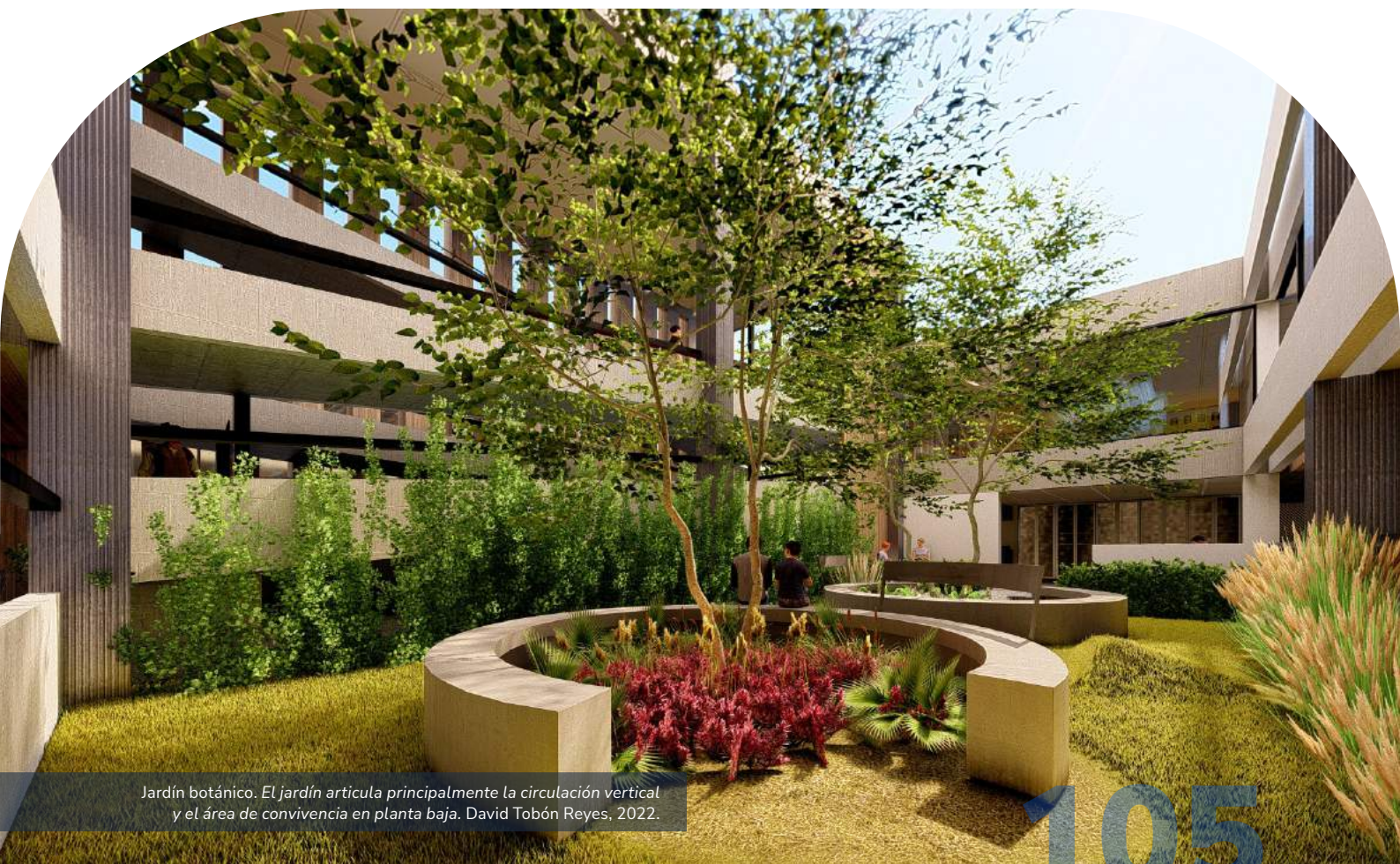
Jardín botánico. El jardín articula principalmente la circulación vertical y el área de convivencia en planta baja. David Tobón Reyes, 2022.

En la planta baja se ubica la sala de exposición temporal, el jardín botánico, una cafetería, servicios y rampas de circulación; cuya función es la de separar y crear distinción entre el espacio del auditorio y el recorrido designado para el museo. En la segunda planta se distribuyen tres salas del tiempo, así como una sala de arte y una más dedicada a los personajes que contribuyeron significativamente a la medicina en Aguascalientes. Por último, en la tercera planta se ubica la zona de administración del museo, al igual que áreas de convivencia como la biblioteca, hemeroteca y terraza.