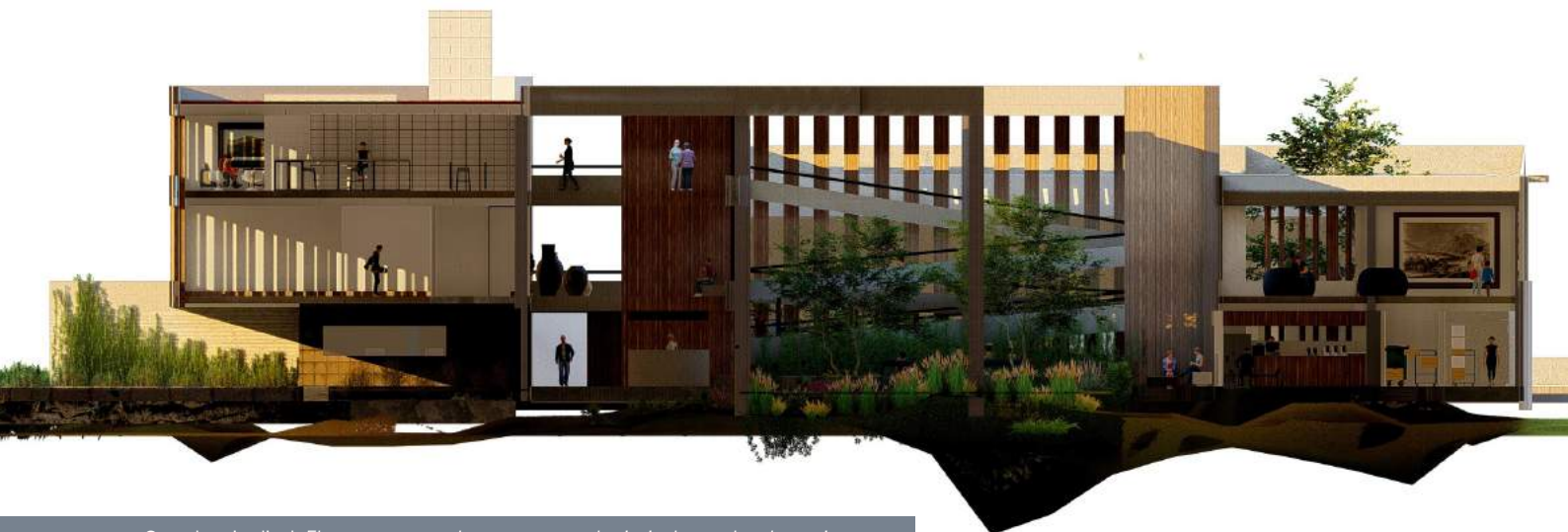
Corte longitudinal. El corte muestra el acceso peatonal principal como la relevancia y jerarquía del corazón como jardín botánico dentro del sistema. David Tobón Reyes, 2022.

Así emergió el jardín botánico como un nodo donde la naturaleza es protagonista en el museo, pues es una metáfora de la trascendencia, que invita a tener conciencia sobre la prevalencia de lo natural, así como el espacio edificado, por encima la mortalidad del ser humano.