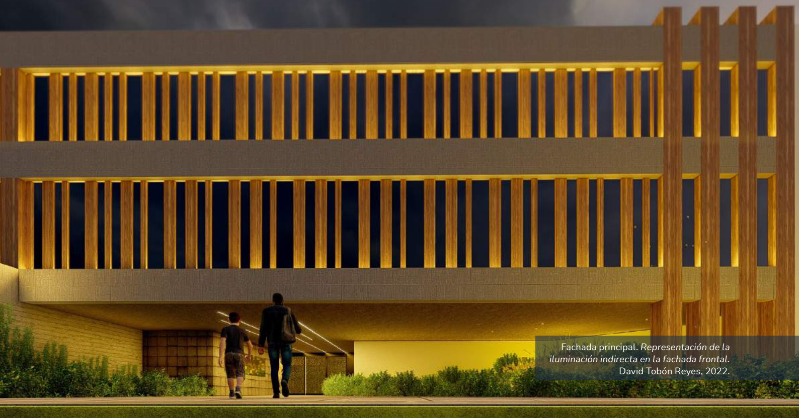
Fachada principal. Representación de la iluminación indirecta en la fachada frontal. David Tobón Reyes, 2022.

El edificio busca proyectar esos valores iniciales, para poder trascender tanto en la información expuesta en sus interiores, como en el conjunto del edificio mismo. De este modo, la propuesta de diseño surgió a partir del análisis del sitio que, debido a sus edificios colindantes y poco valor perceptual en su contexto inmediato, indicaba el camino de una arquitectura introspectiva que generase dentro de sí misma los valores perceptuales que en el exterior no se encontraban.