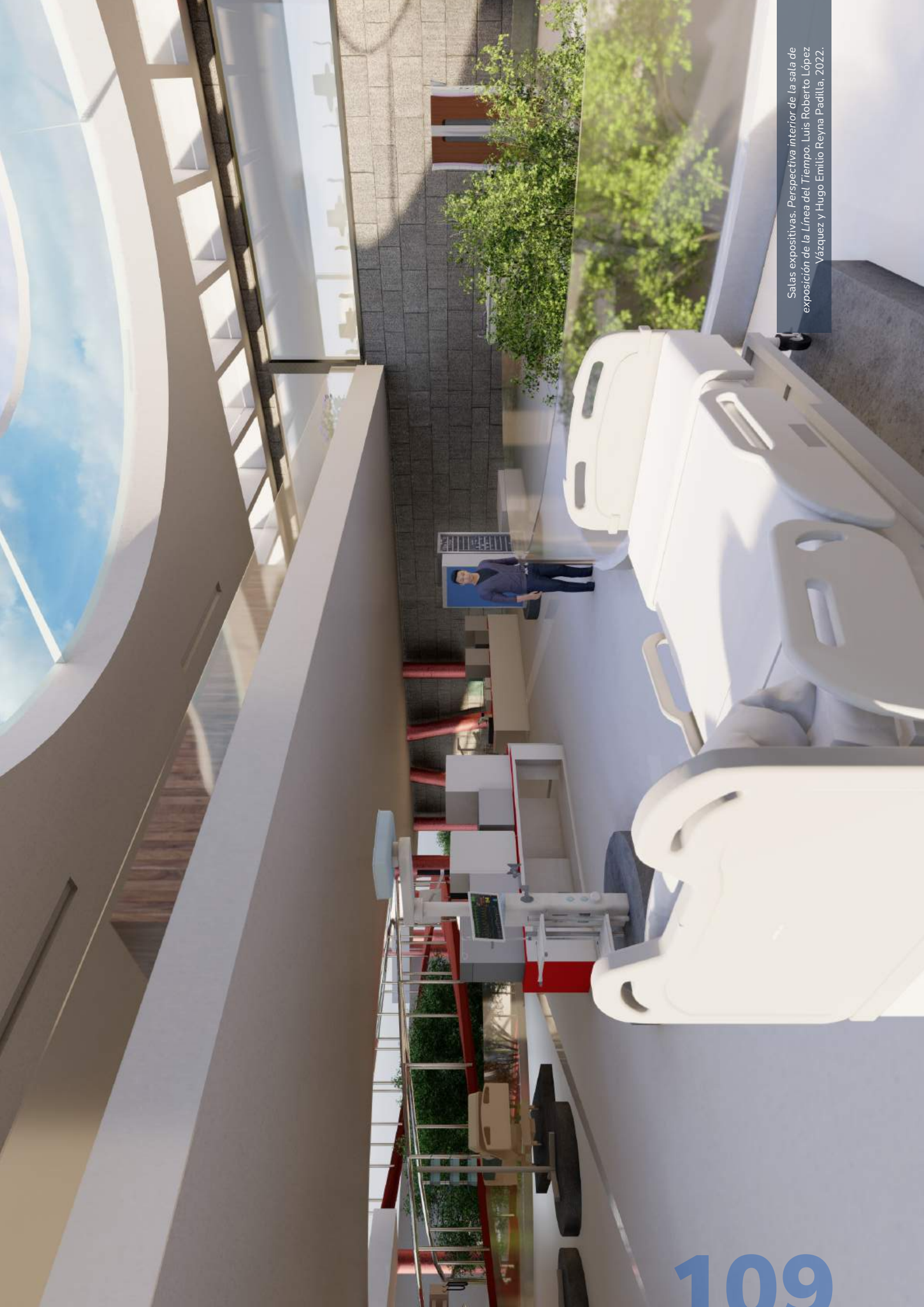
Salas expositivas. Perspectiva interior de la sala de exposición de la Línea del Tiempo. Luis Roberto López Vázquez y Hugo Emilio Reyna Padilla, 2022.