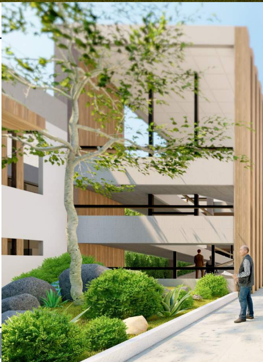
Jardín posterior. Colchón perceptual entre la zona del auditorio como la del museo, siendo diferenciada por la circulación vertical. David Tobón Reyes, 2022.

En la búsqueda de un centro, la interpretación se fundamentó en la cardiología, una de las ramas más importantes de la medicina; encargada del estudio, tratamiento y diagnóstico de las enfermedades del corazón y el aparato circulatorio. Haciendo uso de la abstracción y reconociendo al corazón como el centro vital para el funcionamiento del ser humano, el sistema se proyectó de la misma forma: un componente que articula, bombea y da sentido al proyecto.