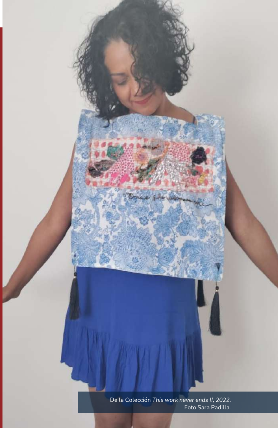
De la Colección This work never ends II , 2022.

En esa modalidad, encontré –como casi siempre– una inspiración poderosa en la acción casera y simple de cocinar, mediante la prenda simbólica del mandil. Reflexioné sobre los posibles propósitos y servicios inhabituales de un mandil, y una vez más, me dispuse a materializar relatos encantadores de mujeres trabajando en cocinas, en la colección de prendas This work never ends I y II para el #stayhome de la era. Con fascinación, respeto, procedimiento y remembranza ( quitar la sartén del fuego, transportar desde el huerto o gallinero, secar lágrimas, limpiar caras sucias... ) una serie de mandiles se convirtieron en mi soporte para bordar ideas, espíritus y sabidurías de estas anécdotas femeninas.