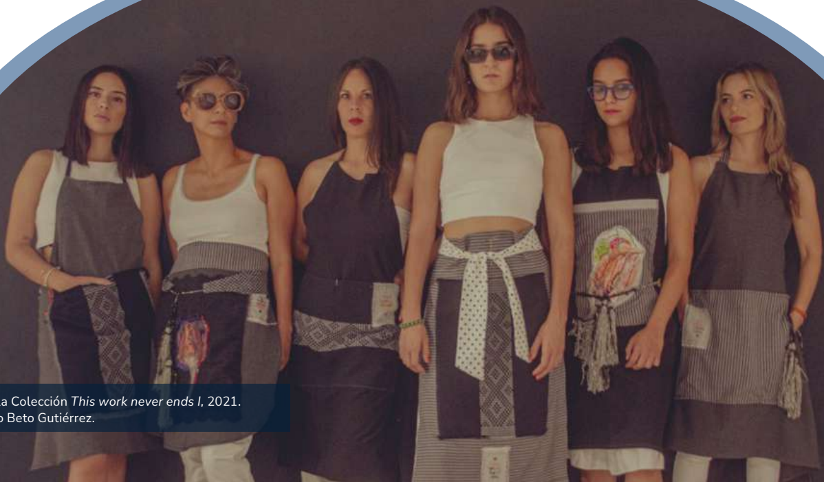
De la Colección This work never ends I , 2021.