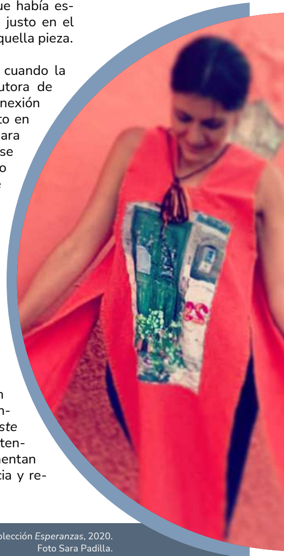
De la Colección Esperanzas , 2020.

Los poseedores aportan a estos objetos, piezas o prendas ( como el lector lo guste referir ), un potencial que no tendrían por sí solos, complementan una significación, clarividencia y revelación muy personal.