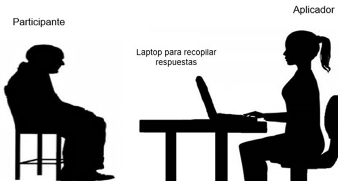
Figura 1. Escenario de aplicación para tarea NAP.

120 ensayos de prueba. Por medio de una tecla, el reloj interno del sistema computacional registraba el tiempo de respuesta.