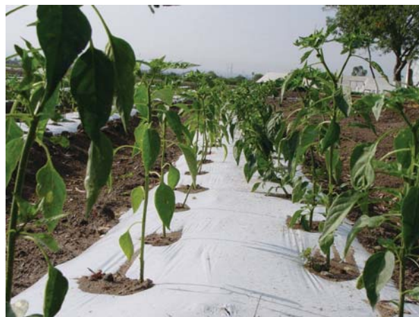
Se usa el abono orgánico en el cultivo de chile ancho.

En los últimos 20 años, Aguascalientes se ha caracterizado por ser una cuenca lechera a nivel nacional. En el año 2003 se tenía un registro de 71,501 cabezas de ganado productor de leche, según datos de SAGARPA (Servicio de Información y Estadística Agroalimentaria y Pesquera). Cruz Medrano, (1986) señala que el bovino de leche produce 20 kg de estiércol por día, lo que equivale a una producción de 1,430 toneladas diarias de estiércol. Las estimaciones totales del contenido de nutrientes del estiércol procedente del ganado lechero son: 23.88 t de N; 15.44 t de P_2O_5 ; 8 t de K_2O y 645 t de materia orgánica (Beltrán Morales et al. , 2004). En consecuencia, se deben proponer alternativas sustentables para la utilización de esa fuente de nutrientes en la producción de cultivos hortícolas bajo sistemas intensivos.