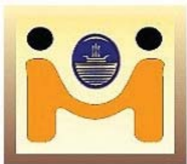
Figura 1. Mediación.

Aguascalientes). También que el uso del Centro de Mediación ha ido en aumento por parte de la ciudadanía anualmente y que la mayoría de los asuntos en donde se inicia un procedimiento de mediación es concluida exitosamente.