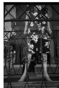
Sin cabeza (1995) Manuel Álvarez Bravo