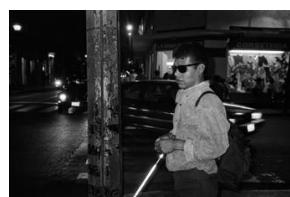
De la serie, Fronteras (1999) Gerardo Nigenda