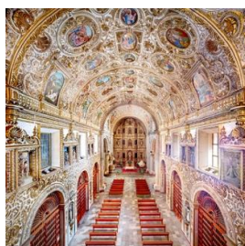
Santo Domingo Oaxaca II (2015) Candida Höfer