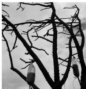
De la serie, Naturata (1998-1999) Graciela Iturbide