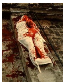
Cuerpo mutilado sobre paisaje (1973) Ana Mendieta