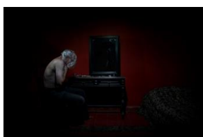
De la serie, Oscurana (2013) Antoine D'Agata