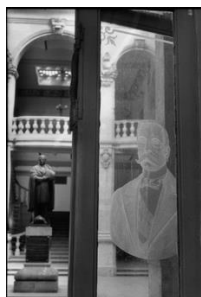
Universidad (1963) Henri Cartier-Bresson