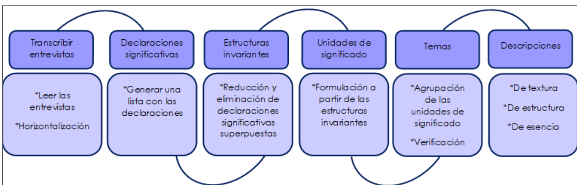
Figura 1. Pasos del proceso de análisis de Moustakas (1994).

Las entrevistas se realizaron entre los meses de noviembre de 2020 y enero de 2021 durante la suspensión de clases presenciales y cuando aún se desconocía la fecha de regreso a las aulas. Por cuestiones propias del aislamiento las entrevistas se realizaron por videollamada en Zoom o Meet y por llamada telefónica, la manera la decidía el directivo. En promedio las entrevistas tuvieron una duración de 90 minutos. Para sistematizar la información se siguió el modelo propuesto por Moustakas (1994) para analizar información fenomenológica (figura 1). Se inició el análisis transcribiendo las entrevistas, para después leerlas con detenimiento y comprender de manera general lo dicho por los sujetos para describir su experiencia, esto es el proceso de horizontalización .