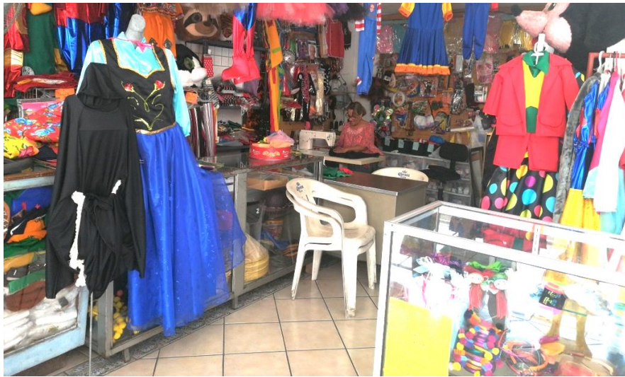
Figura 1. Visita a las empresarias para la aplicación de encuestas.

Los criterios para integrar la muestra fueron ser empresarias asociadas a la CANACO de los estados incluidos en el estudio, y que estuvieran dispuestas a participar en la investigación, contestando el cuestionario.