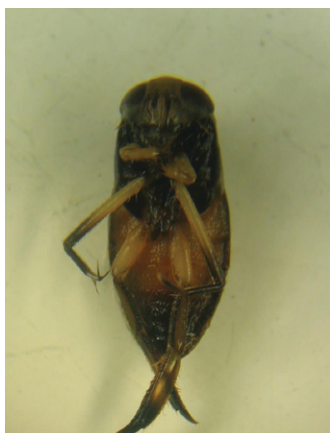
Foto 1. Imagen de Graptocorixa abdominalis (macho), representante de la familia Corixidae (Hemiptera).

El embalse Macua se localiza a una altitud de 2,320 msnm, entre los 99° 30' 00'' y 99° 32' 00'' longitud oeste y 20° 06' 00'' y 20° 08' 00'' latitud norte en el municipio de Soyaniquilpan de Juárez, Estado de México. Es una zona en la que predomina un clima templado subhúmedo con lluvias de verano (Cw (Wo) w) (García, 1988). Se ubicó una estación de muestreo en la parte litoral del embalse. Dicha estación fue seleccionada con base en su accesibilidad. En ella se tomó una muestra original y dos réplicas a intervalos de una hora (iniciando a las