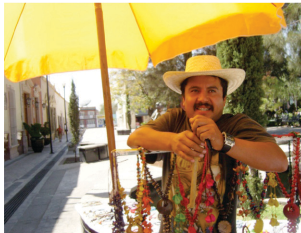
Figura 3. Fotografía que muestra a vendedor ambulante en el Jardín del Encino.

Otros comerciantes son clandestinos, como una comerciante de alimentos, que trabaja conjuntamente con otras personas en el Jardín del Encino. “Se instalan en el lado oriente del jardín en la boquería destruida por los vándalos –generalmente estudiantes– del entorno”, (E17.2) comenta el señor bolero “el sitio para bolear, está desocupado, pues no hay casi trabajo suficiente porque no hay muchas misas y bodas entre semana, y mi hermano lo ha abandonado para tales labores” (E17.2)-bolear. El mismo bolero agrega: “ahí, entre semana la señora vende comidas ‘por encargo’, para los obreros de la fábrica de textiles De Jobar, S.A. Antes, ella traía hasta una mesa con sillas para que pudieran comer a gusto, ahora ellos se sientan por donde pueden, repartidas por el jardín” (E17.2). Algunas empleadas de la fábrica comentan: “venimos aquí, porque el comedor de la fábrica es pequeño y encerrado, además es muy caro y sirven muy poco; en cambio, el jardín es agradable, y descansamos de la fábrica” (E17.3). En general, “no venimos a diario, porque la fábrica nos descansa dos o tres días a la semana, así que sólo le hacemos pedi-