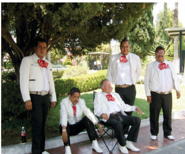
Figura 2. Fotografía de Mariachi en espera de ser contratado en el Jardín Zaragoza.