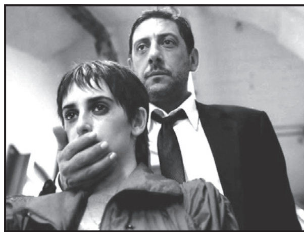
Figura 2. Italia (Penélope Cruz) y Timoteo (Sergio Castellitto), en No te muevas .

En No te muevas , como se ha mencionado, el protagonista viola al personaje central femenino, en un marco de espacio simbólico en el que la crueldad hacia las mujeres es presentada como algo válido. Y como se aprecia en la figura 2, su cuerpo se halla silenciado y dominado por la figura masculina, inclusive en su rostro se observa una resignación que toca la insensibilidad como recurso para amortiguar el dolor. Inclusive, el ángulo de la toma muestra al hombre en lugar más elevado, lo que nos conduce a lo precisado por Ortner y Whitehead: "en la mayoría de las culturas las diferencias entre hombres y mujeres son pensadas, de hecho, como conjuntos de oposiciones binarias asociadas metafóricamente (después de todo, incluso una escala tiene siem-