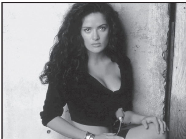
Figura 1. Carolina (Salma Hayek), en Desperado .