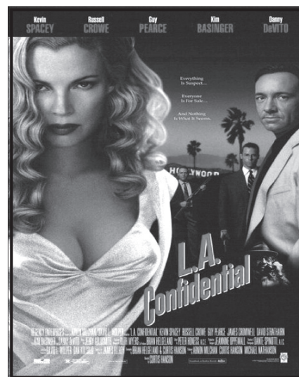
Figura 4. Cartel de la película L.A. Confidential .