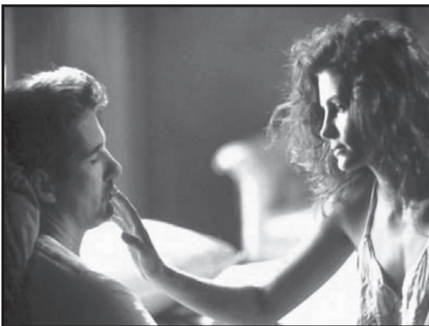
Figura 3. Edward Lewis (Richard Gere) y Vivian Ward (Julia Roberts), en Mujer bonita .

Sobre este filme se ha dicho que contiene dos elementos negativos, “la alta carga erótica de varios pasajes; y la pasividad de Italia ante las primeras acometidas de Timoteo, poco menos que increíble, e irritante en una sociedad donde abundan las violaciones y la violencia doméstica” ( http://www.decine21.com/Peliculas/No-te-muevas-723 ).