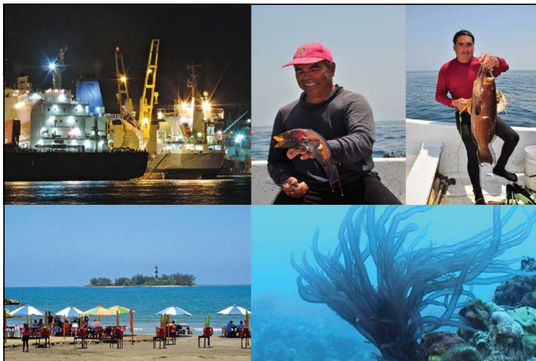
Figura 2. Principales actividades económicas: portuaria, turismo, pesca, que se desarrollan en el Parque Nacional Sistema Arrecifal Veracruzano y su impacto sobre la flora y fauna asociadas a los arrecifes.