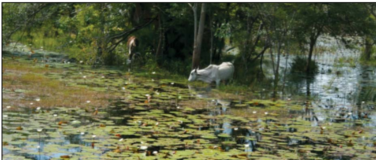
Figura 2. Vegetación hidrófila y ganado en la Reserva de la Biósfera Pantanos de Centla.

usos agropecuarios y urbanos, y para la construcción de infraestructura de transporte y de aquella relacionada con las industrias petrolera y turística. La información disponible sugiere tasas anuales de deforestación muy variables de región a región, en algunas localidades del Caribe mexicano alcanzan hasta 12% de pérdida anual (Núñez Farfán et al., 1997). La pérdida de cobertura de los manglares de México, en general, ha sido dramática con una reducción del 41% de la cobertura original (INEGI 2005a, b).