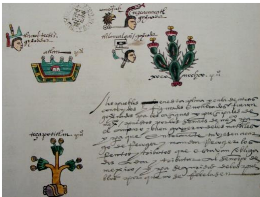
Figura 5. Instauración de gobernantes del Altiplano en las provincias de Atlan y Tetzapotitlan de acuerdo con el Códice Mendoza. Imagen tomada de Berdan & Anawalt (1992).

No obstante, la principal mano de obra explotada por la Triple Alianza no era la de los habitantes del Altiplano beneficiados con tierras en las provincias sujetas, pues recordemos que, en su mayoría, solamente ocurrieron instauraciones e imposiciones de un sector político en las localidades sin ocurrir movimientos poblacionales considerables, como sí ocurre en Tetzapotitlan (Márquez Lorenzo, 2020). En todo caso, el interés por el dominio de esta provincia sí tuvo un trasfondo económico, por ser éste el fin del expansionismo militar mexica.