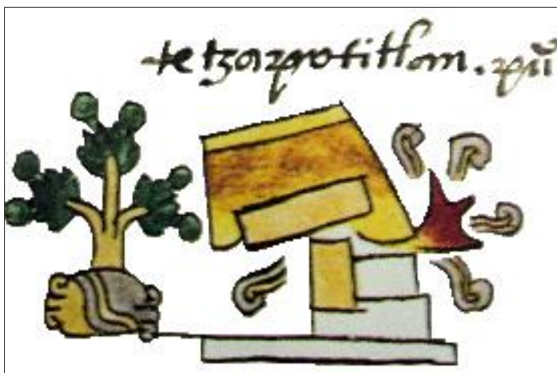
Figura 3. Representación de Tetzapotitlan o Tetzapolco en el Códice Mendoza.