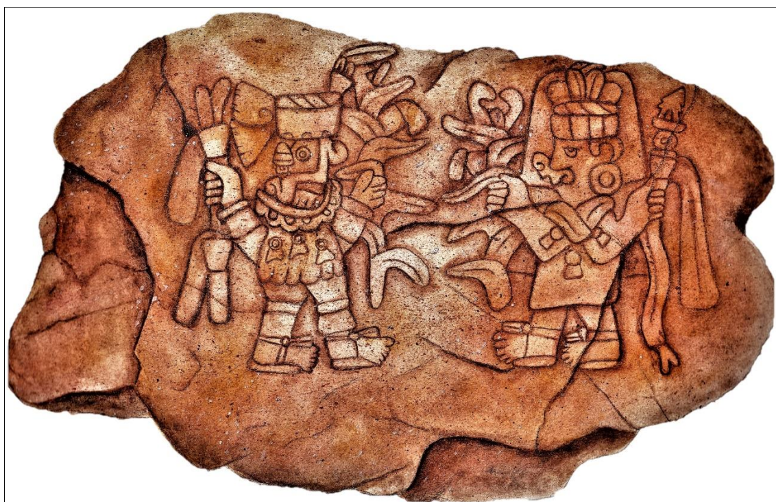
Figura 6. Representación de Tláloc y Chicomecóatl en el monumento 41 de Tetzapotitlan, también conocido como 'piedra del maíz'.

Posteriormente a la ocupación territorial el desarrollo cultural de Tetzapotitlan fue permeado por un nuevo régimen, que lejos de sólo intervenir como mediador para la extracción de tributo se empeñó en hacer notar su presencia en las parafernalias rituales públicas (Márquez Lorenzo, 2017, 2020, 2021b). Esto explica la proliferación de númenes e imagería mexicas en las esculturas de Tetzapotitlan y otros sitios (figura 6), algunas de las cuales sirvieron para celebrar el Toxih molpilia de 1507, ceremonia efectuada cada 52 años (Márquez Lorenzo, 2012a, 2012b, 2015, 2017, 2020). Su pertinencia habría sido dada no sólo mediante un orden político sino social, a través de la juventud nacida y crecido bajo las nuevas manifestaciones culturales.