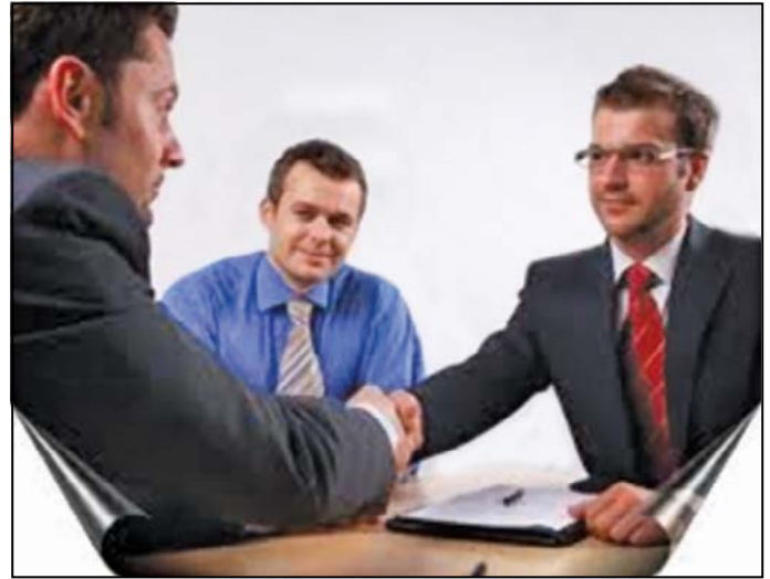
Figura 2. La puerta de acceso para la detección del talento en las empresas y el establecimiento de un compromiso: la entrevista de trabajo.

cuantitativa, la investigación es un estudio de tipo descriptivo y correlacional. Debido a que el objetivo no es obtener una muestra representativa de la población, la de esta investigación es considerada de conveniencia, debido a que se depende del permiso de la institución, de los profesores y de los participantes para la recolección de los datos.