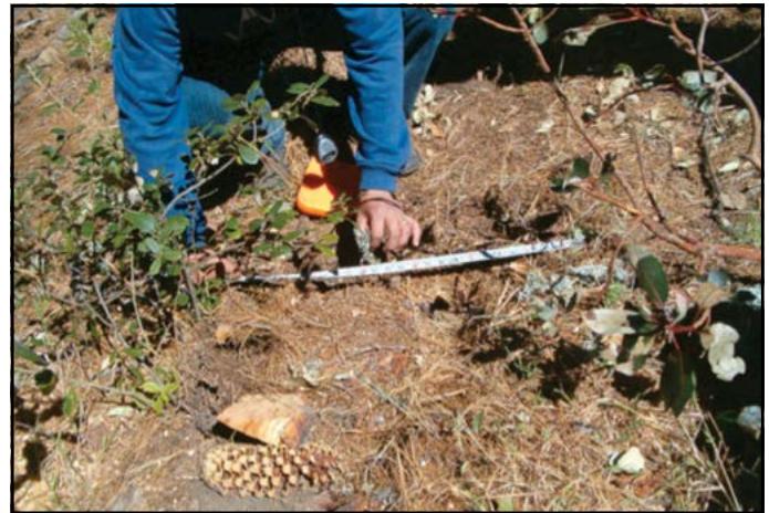
Figura 3. Establecimiento de un sitio de muestreo.

Para el cálculo de la densidad aparente se usó el método del cilindro de volumen conocido (Forsythe, 1975). Las muestras fueron colocadas en una bolsa de papel con la identificación del sitio y la profundidad de extracción de la muestra. El secado de las muestras se hizo en estufa a 100 °C durante 72 h; ya secas, las muestras se pesaron en una balanza analítica para determinar su peso seco con el fin de determinar la densidad aparente del suelo mediante la siguiente relación: