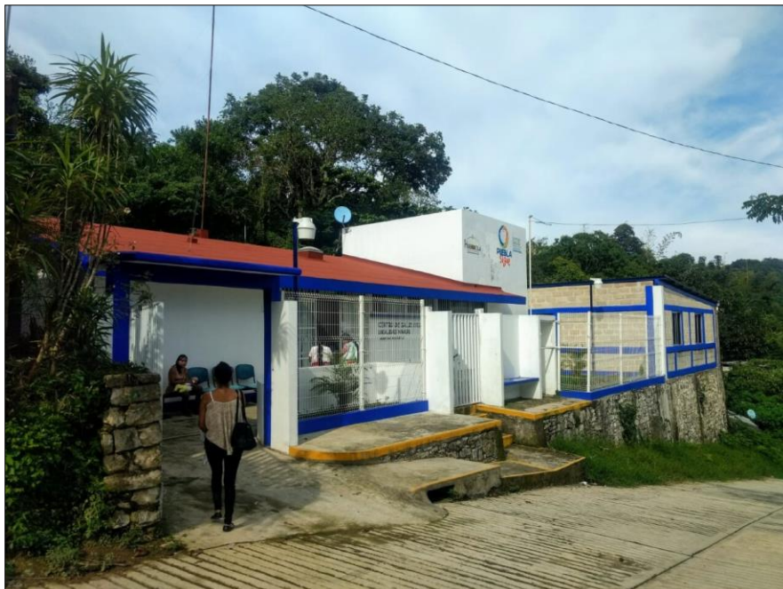
Figura 1. Para otorgar cuidado a la salud, el personal que lo otorga debe de contar con las competencias de conocimiento, actitud, habilidad y destreza.

Por otro lado, la educación es un derecho humano fundamental que tiene por objeto desarrollar competencias para la transformación del individuo e impactar en temas como la disminución de la brecha de género, reducir los índices de marginación, en lo que respecta a materia de salud, la reducción de la morbilidad y mortalidad de grupos vulnerables (Organización de las Naciones Unidas para la Cultura, las Ciencias y la Educación, 2019).