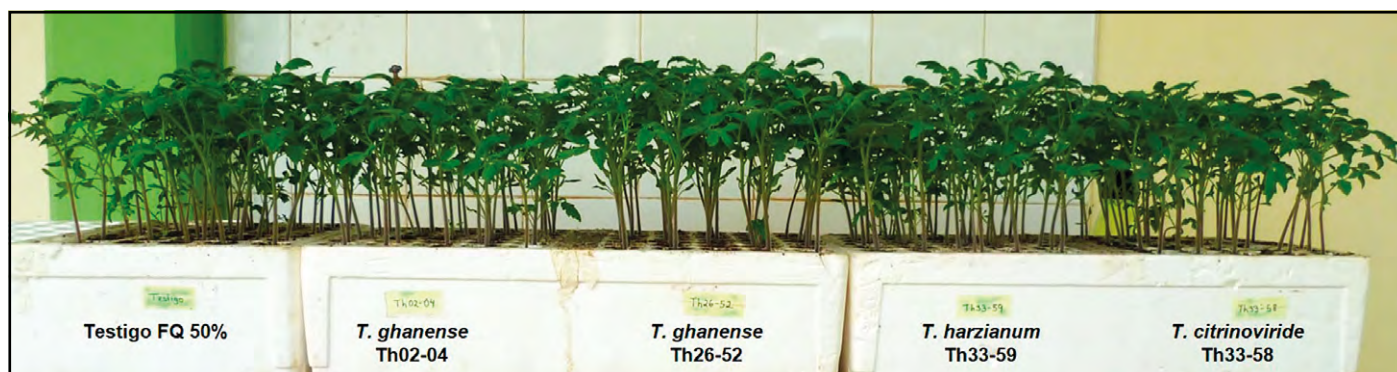
Figura 2. Efecto de la inoculación de Trichoderma spp. en la promoción de crecimiento de plántulas de S. lycopersicum .

Nota: DMS: diferencia mínima significativa. Medias con diferente literal en las columnas son estadísticamente diferentes ( p \leq 0.05 ). Elaboración propia.