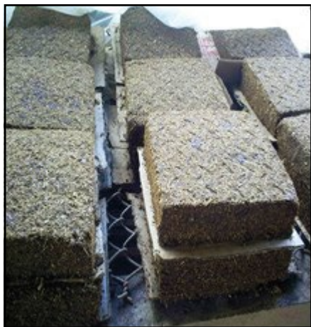
Figura 2. Bloques multinutricionales (BMN) elaborados.

La valoración nutritiva se realizó en el Laboratorio de Nutrición Animal de la Escuela de Zootecnia, Universidad de Oriente, Venezuela. Se colectaron muestras de los pastos suministrados, de la bora y el malojo de maíz utilizado en las fórmulas y de los bloques multinutricionales elaborados. Los análisis bromatológicos determinados fueron materia seca (MS), ceniza (Cnz), materia orgánica (MO), proteína cruda (PC), extracto etéreo (EE) y fibra cruda (FC) de acuerdo con normativas de la AOAC (2000); mientras que el extracto libre de nitrógeno (ELN) se calculó por diferencia mediante la fórmula \% \text{ELN} = 100 - (\% \text{PC} + \% \text{FC} + \% \text{EE} + \% \text{Cnz}) .