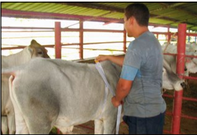
Figura 3. Medición de variables zoométricas (Perímetro torácico).

Variables zoométricas en los animales. La medición de las variables zoométricas en los animales se realizó al principio y al final del experimento, según metodología descrita por Gómez y Jiménez Rodríguez (2009) correspondiente a perímetro torácico (PT); longitud corporal (LC) y altura corporal (AC) (figura 3). La fórmula utilizada para calcular la variación fue Variación de la PT, LC y AC = Medida final – Medida inicial.