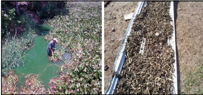
Figura 1. Cosecha (izquierda) y secado al sol (derecha) de la bora.