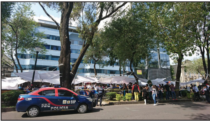
Figura 2. Ocupación provisional del camellón Álvaro Obregón para la evacuación de pacientes y personal médico durante el sismo de septiembre de 2017 en la Ciudad de México.

disponibilidad de camas adicionales, procedimientos para la expansión provisional del departamento de urgencias y otras áreas críticas; la forma y las actividades que se deben realizar en la expansión hospitalaria, como el suministro de agua potable, electricidad, desagüe, entre otros; los procedimientos para la habilitación de sitios para ubicación temporal de medicina forense, actividades específicas para el área de patología y si tiene sitio destinado para depósito de múltiples cadáveres (OPS, 2008). No contar con espacios libres dentro del nosocomio hace necesario el uso de calles, plazas o camellones para evacuar pacientes durante una calamidad (figura 2).