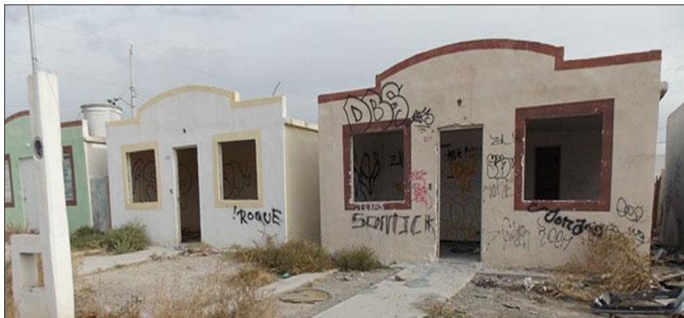
Figura 1. Casas abandonadas a causa de la violencia en Celaya, Guanajuato. Fotografía tomada de Informativo Ágora (23 de mayo de 2021).

El corredor industrial del estado de Guanajuato es una zona geográfica estratégica caracterizada por la atracción de inversiones, generación de empleos y dinamismo económico; posee importante conectividad a través de carreteras y vías férreas con las ciudades de México, Querétaro, Morelia, Guadalajara, Aguascalientes y San Luis Potosí. Sin embargo, durante los últimos años se ha incrementado la inseguridad y violencia en esta zona, debido a la presencia de grupos criminales y el aumento en la incidencia delictiva, lo que coloca a Guanajuato entre la lista de los estados más peligrosos de México. Esta ola de violencia se atribuye a la disputa entre bandas criminales dedicadas al robo de hidrocarburos y venta de drogas, principalmente (INEGI, s. f.).