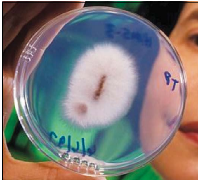
Figura 2. Crecimiento fúngico de F. oxysporum .

Por último se evaluó el tiempo de duplicación. Este parámetro indica la velocidad con la que un microorganismo crece, pero con relación inversa. Si se incrementa el tiempo de duplicación, el valor