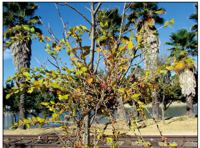
Figura 2. Cladocolea loniceroides parasitando fresno ( Fraxinus sp.).

Las especies de la familia Loranthaceae son una fuente importante de néctar y frutos para las aves, algunas de las cuales se alimentan casi exclusivamente de los frutos de este grupo (Stevens, 2001) y como sucede con los muérdagos en general, las aves son los principales dispersores de semillas (Watson, 2001), dicha dispersión ocurre por medio de tres mecanismos: