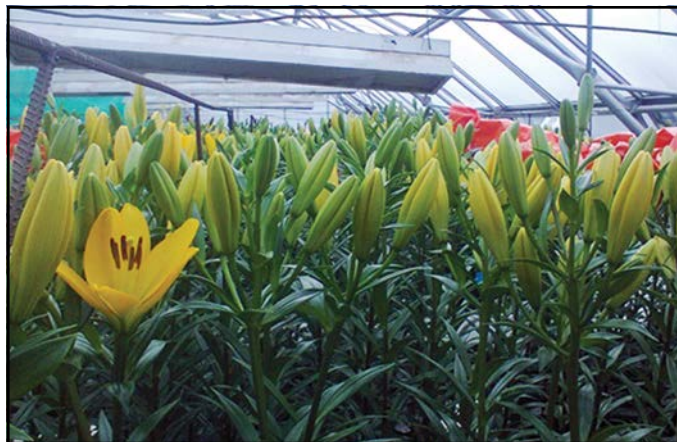
Figura 2. Se estudia la influencia del Mg y el Zn en características de Lilium .

La aplicación de 10 ml/maceta/20 días de solución Steiner (1961) aumentada 40 veces para generar una dosis de N de 53 mg N/maceta/20 días generó mayor altura de tallo en Lilium 'Acapulco', en comparación con una dosis de 20 ml/maceta/10 días. No existió diferencia en el índice de verdor de