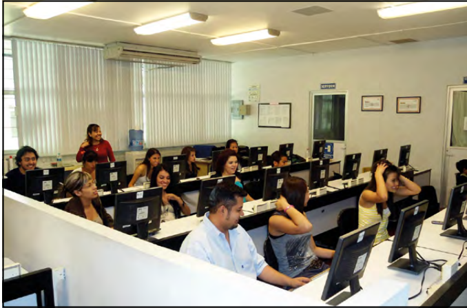
Figura 2. Aprendizaje de la programación.

participantes, ni en las correlaciones, ni en el modelo de regresión generado. Esto puede interpretarse dada la evidencia empírica de otros estudios relacionados con el tema (Azevedo & Alevén, 2013; Forbes-Riley & Litman, 2010) como una falta de desarrollo de las habilidades metacognitivas en los estudiantes de este nivel inicial de estudios.