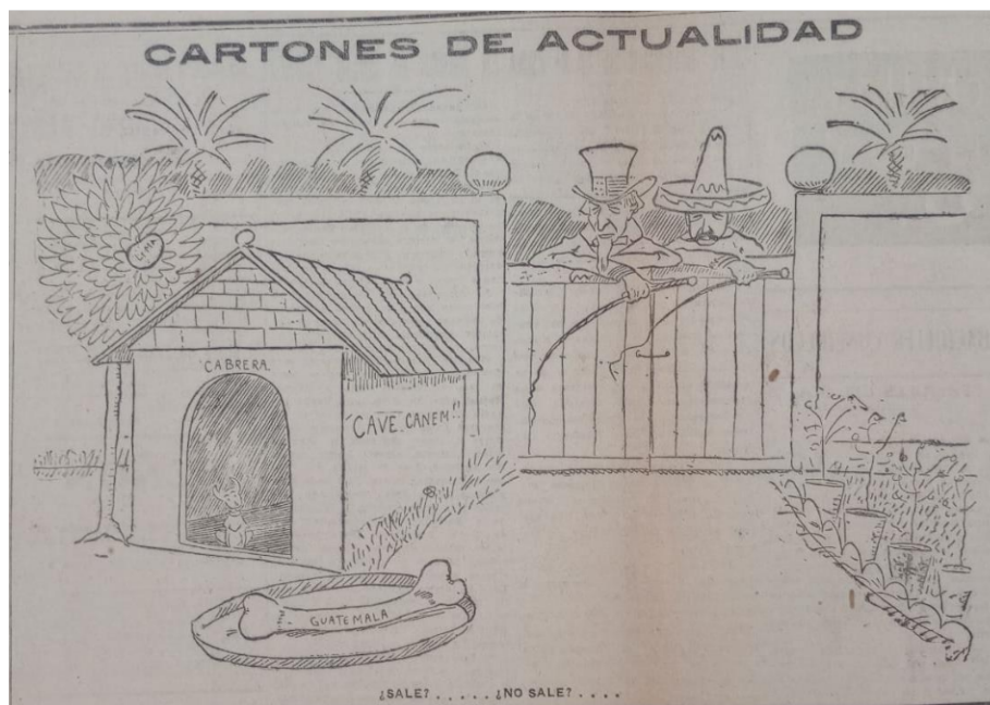
Ilustración 1. Cartones de actualidad , 1907.

“Dibujo sobre el Tío Sam y un mexicano detrás de un portón que están esperando a que salga un chihuahua con la leyenda de “Cabrera”.