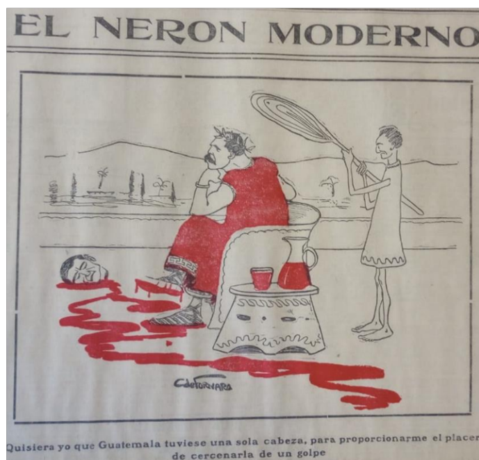
Ilustración 3. El Nerón Moderno , 1908.

“Dibujo sobre Porfirio Díaz retratado como el emperador Nerón, en sus pies está cortada la cabeza de un hombre, mientras que a su lado es ayudado por un esclavo a que se ventile”.