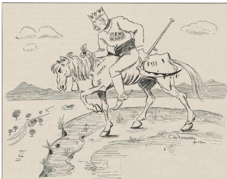
Ilustración 5. El fin del jinete , 1911.

“Dibujo sobre Porfirio Díaz a punto de cruzar Estados Unidos, pero que no puede cruzar a causa de lo débil que es el caballo”. Fuente: NYU, The Masses , junio de 1911. P.9. Traducción: propia.