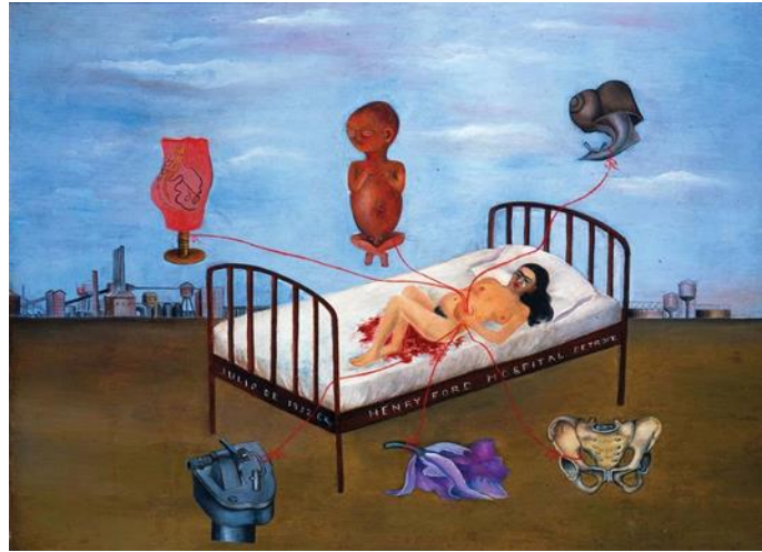
Imagen 1. Frida Kahlo, Henry Ford Hospital , 1932. Óleo sobre metal, 30.5 x 38 cm, Colección de Dolores Olmedo Patiño, Ciudad de México. Fuente: Matador Network, “La historia del cuadro Henry Ford Hospital de Frida Kahlo”, https://matadornetwork.com/es/la-historia-del-cuadro-henry-ford-hospital-de-frida-kahlo/ (Fecha de consulta: 6 de diciembre de 2018).

∞ Unos cuantos piquetitos (1935): Para este cuadro del año de 1935, Frida se basó en un hecho real, en donde la imagen es impresionante y hasta cierto punto inquietante. El hecho ocurrido, es narrado en el diario de Frida, quien cuenta la noticia, en donde un hombre, asesinó a una mujer a cuchilladas y declaró ante el juez que sólo le dio unos piquetitos. En el cuadro, se puede apreciar a un hombre de pie junto a una cama con un cuchillo en la mano, en ella está una mujer desnuda y la sangre sale de ella salpicando toda la habitación. Incluso ella llega a revelar la siguiente frase: “Esa mujer asesinada en cierto modo era yo, a quien Diego asesinaba todos los días. O bien la otra, la mujer con quien Diego podía estar y a quien yo hubiera querido hacer desaparecer”. 18