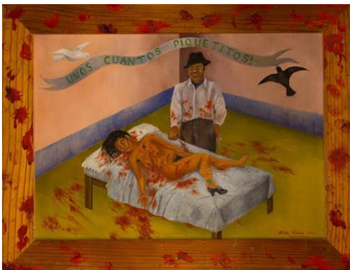
Imagen 2. Frida Kahlo, Unos cuantos piquetitos , 1935. Óleo sobre metal, 30 x 40 cm, Colección de Dolores Olmedo Patiño, Ciudad de México.

∞ Unos cuantos piquetitos (1935): Para este cuadro del año de 1935, Frida se basó en un hecho real, en donde la imagen es impresionante y hasta cierto punto inquietante. El hecho ocurrido, es narrado en el diario de Frida, quien cuenta la noticia, en donde un hombre, asesinó a una mujer a cuchilladas y declaró ante el juez que sólo le dio unos piquetitos. En el cuadro, se puede apreciar a un hombre de pie junto a una cama con un cuchillo en la mano, en ella está una mujer desnuda y la sangre sale de ella salpicando toda la habitación. Incluso ella llega a revelar la siguiente frase: “Esa mujer asesinada en cierto modo era yo, a quien Diego asesinaba todos los días. O bien la otra, la mujer con quien Diego podía estar y a quien yo hubiera querido hacer desaparecer”. 18