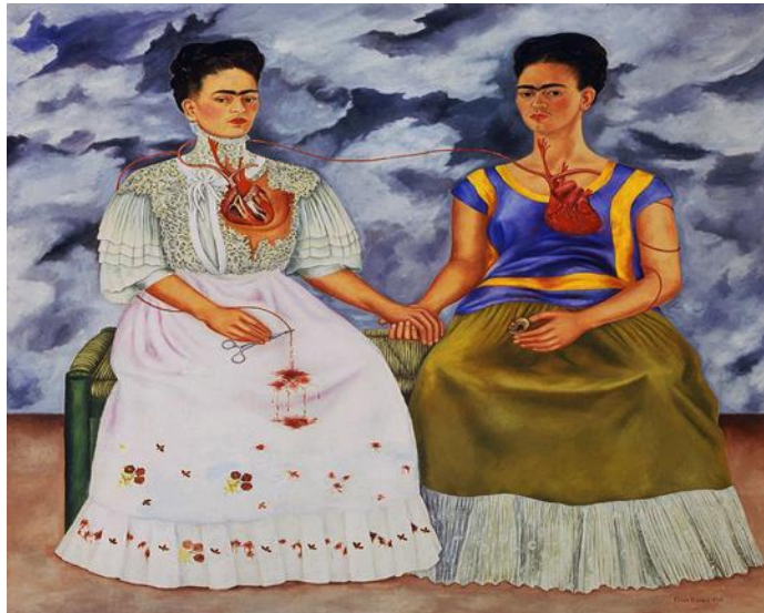
Imagen 3. Frida Kahlo, La dos Fridas, 1939. Óleo sobre lienzo, 173.5 x 173 cm, Museo de Arte Moderno, Ciudad de México.

∞ Autorretrato como tehuana – Diego en mi pensamiento (1943): Esta pintura data del año de 1943, aunque fue comenzada en 1940 año en que Diego y Frida ya habían vuelto a contraer nupcias. En esta pintura Frida porta un traje típico de tehuana, cosa que le fascinaba a Diego y que sin duda era característico de la personalidad de la artista. En su frente se puede apreciar un retrato de Diego y de su cabeza salen una especie de telarañas que