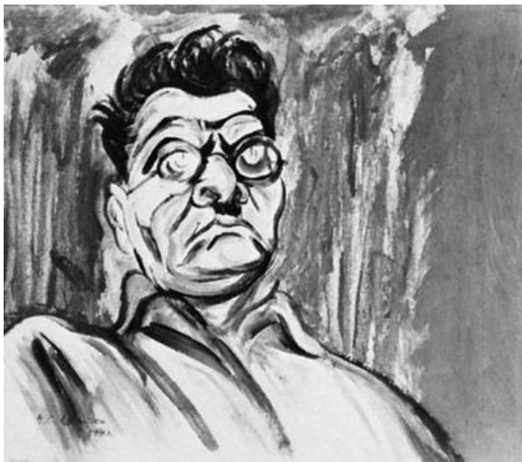
Imagen 3. El hombre tecolote. José Clemente Orozco y la novedad de su Autocaricatura .

En conclusión, hacia el Orozco como dibujante, es importante mencionar el espíritu, la fuerza de comunicación y la sátira de las caricaturas del artista jalisciense, ya que principalmente estas iban dirigidas hacia los amplios sectores del pueblo mexicano. José Clemente Orozco, hasta ese entonces, era considerado como un dibujante lépero que ilustraba para periódicos populares “algunos lo consideran como el caricaturista de las clases pobres”, 4 a comparación de José Guadalupe Posada, “conviene no olvidar que Posada entró a la circulación artística dentro de la clase media mexicana, (...) el Orozco caricaturista no entró a los círculos dictaminadores del gusto”. 5