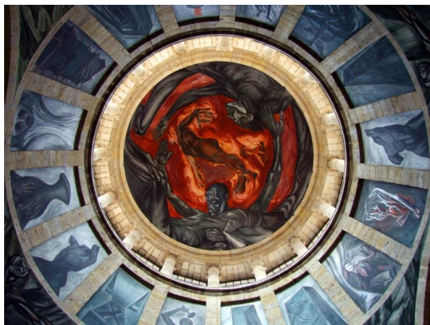
Imagen 9. José Clemente Orozco, El hombre de fuego , 1939. Fresco en cúpula, Instituto Cultural Cabañas.

El Hospicio Cabañas, ubicado en Guadalajara, Jalisco, fue edificado a principios del siglo XIX, teniendo como principal función el asilo de los desamparados, así como ancianos, huérfanos y discapacitados. El edificio en sí es extraordinariamente bello, debido a que muestra elementos absolutamente originales, sin desatender las necesidades de los asilados. Ya entrado el siglo XX, la capilla que se encuentra en el hospicio