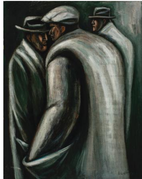
Imagen 7: José Clemente Orozco, Los desempleados , ca. 1929. Óleo sobre lienzo, 65 x 52 cm., Collection of Gertrude Finnerud.

La pintura, además de demostrar la situación política, social y económica de Estados Unidos, manifiesta como se desempeñaban los hombres en las calles estadounidenses, pero interesantemente, esta pintura fue la conclusión para el muralista en representar un tema de la vida urbana. A partir de esta obra, Orozco desaparece los temas callejeros de sus obras.