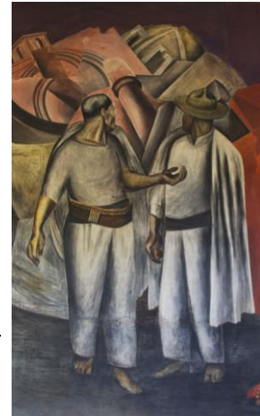
Imagen 5: José Clemente Orozco, La destrucción del viejo orden , 1926. Fresco, Antiguo Colegio de San Idelfonso, anteriormente Escuela Nacional Preparatoria. Fuente: Antiguo Colegio de San Idelfonso, “Acervo”, http://www.sanildefonso.org.mx/mural_destruccion.php?iframe=true&width=810&height=100% (Fecha de consulta: 05 de diciembre del 2018).

El tema principal de este fresco es el de la fortaleza y solidez de las instituciones que anhela el México después de la Revolución Mexicana. En segundo plano, detrás de los hombres se puede apreciar la arquitectura destruida.