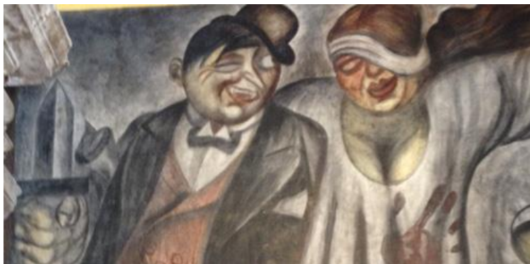
Imagen 6: José Clemente Orozco, La ley y la justicia , 1926. Fresco, Antiguo Colegio de San Idelfonso, anteriormente Escuela Nacional Preparatoria.

Este fresco es uno de los más críticos de Orozco, pues se hace alusión a las mentiras y fraudes de estos dos conceptos ( ley y justicia ). La ley es personificada por el hombre que, aparentemente está en estado de ebriedad, con él, trae consigo en su mano derecha una daga. La justicia, con una venda mal colocada, expresa la justicia ciega y desequilibrada.