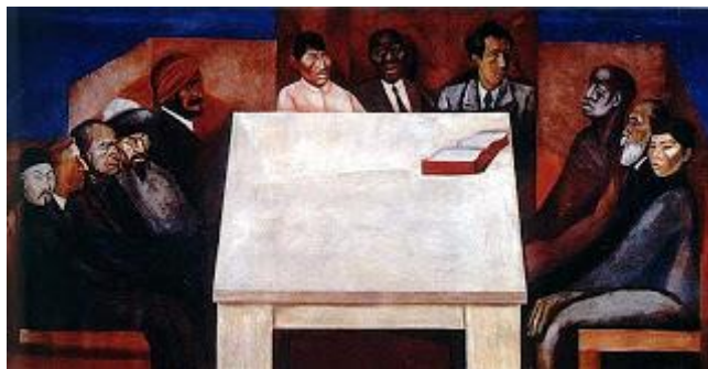
Imagen 8. José Clemente Orozco, Mesa de la fraternidad universal , 1930-1931. Fresco, New School University, New York. Fuente: Business Wire, “José Clemente Orozco: Exposición Histórica Galería Maya Stendhal, Chelsea, New York”, https://www.businesswire.com/news/home/20060426005631/es/ (Fecha de consulta: 05 de diciembre del 2018).

Durante su segunda estancia en Estados Unidos, Orozco pintó diversos murales en aquel país, sobre todo en instituciones educativas. Una de las instituciones donde Clemente Orozco tendría presencia fue en la New School ( la Nueva Escuela de Investigaciones Sociales de Nueva York ), ubicada en la ciudad de Nueva York. El mural