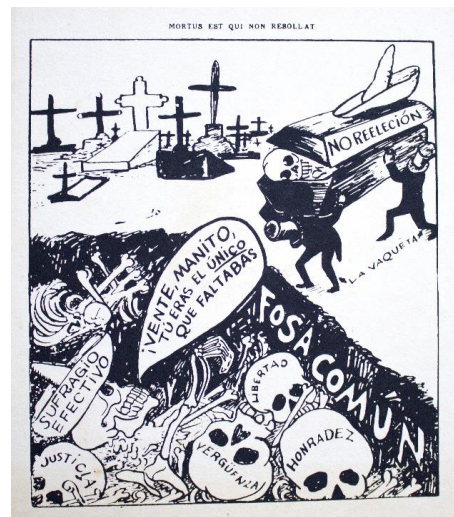
Imagen 2. Caricatura de José Clemente Orozco haciendo crítica a la presidencia de Francisco I. Madero.

Hubo diversos periódicos donde se publicaron caricaturas elaboradas por Orozco: El Imparcial , El Malora , La Vanguardia , El Machete , L'abc , El Ahuizote , El Mundo Ilustrado , Frivolidades , Lo de menos , Panchito , Ojo Parado , México y El Heraldo de México . Esta información nos puede proporcionar el amplio repertorio de periódicos que requerían los trabajos de Orozco, en los cuales usaba como medio de comunicación la sátira, direccionado hacia