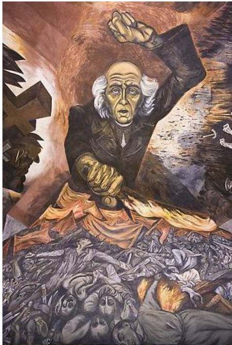
Ilustración 10. José Clemente Orozco, Miguel Hidalgo , 1937. Fresco, Palacio de Gobierno del Estado de Jalisco.

y volúmenes. La fantasía y la originalidad son dos de los elementos que más se descubre en esta obra. “La obra se sostiene por sí misma, por sus realidades interiores: su reino es la emoción (...) La obra de José Clemente Orozco es un canto y una crítica poblada de sarcasmos”. 12 El hombre envuelto en llamas no es más que otro significado que la conquista del hombre, revelándose contra todos los obstáculos que le pueden acaecer.