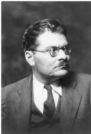
Imagen 1: José Clemente Orozco.

José Clemente Ángel Orozco Flores, o mejor conocido como José Clemente Orozco , nació el 23 de noviembre de (1883), en Zapotlán, (donde actualmente se le conoce como Ciudad Guzmán), Jalisco. El muralista formó parte del llamado “Grupo de los Tres”, conformado por los muralistas mexicanos Diego Rivera y David Alfaro Siqueiros, quienes “fueron para su tiempo y considerados tanto en lo artístico como