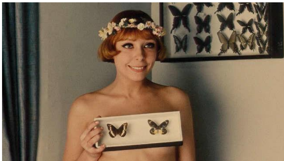
Ilustración 2. Escena de Las margaritas , dirigida por Věra Chytilová, (1966, Checoslovaquia: Barrandov Studios, 2016). Película.

La película de Las margaritas es dadá porque no tiene una narrativa lineal, se presentan diversas situaciones donde el único conector entre ellas son las protagonistas y su anarquía. La filosofía de la película evoca a lo irracional, ir en contra de la razón del sistema usando la imagen femenina como estandarte de libertad. Siguiendo la idea del manifiesto, la autora pasa de ser artista a convertirse en crítica del sistema socialista, ensucia al poder, corrompe a sus personajes y al espectador, para que se deje seducir por el juego y la construcción y destrucción de lo real.