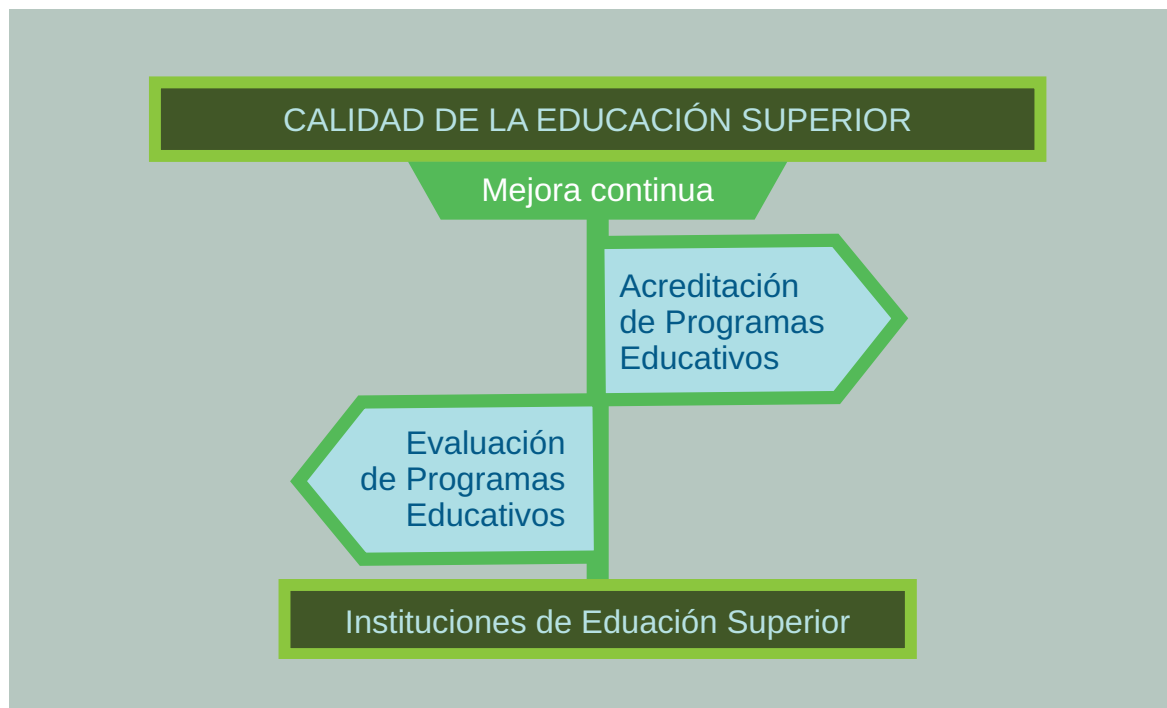
Esquema de estrategias para la mejora continua. Elaborado por María Teresa de León Gallo.

Por lo anterior, las IES están obligadas a la búsqueda de una mejora académica permanente y, durante este proceso, el rol de las responsabilidades atañe, sin excepción, a quienes intervienen en las distintas actividades de los programas educativos.