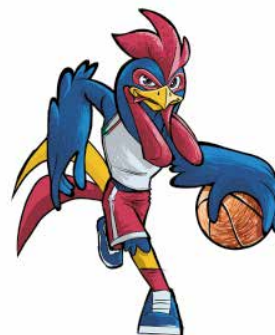
Imagen 6. Gallo UAA básquetbol

Los símbolos universitarios van más allá de ser solo trazos, colores, formas, letras... cada uno de ellos, y en conjunto proyectan la imagen y filosofía de la UAA, “altamente valorada y apreciada por su comunidad y por la sociedad en general” (UAA, 2016a, p. 14) y que nos hacen sentir orgullosamente gallos, orgullosamente universitarios .