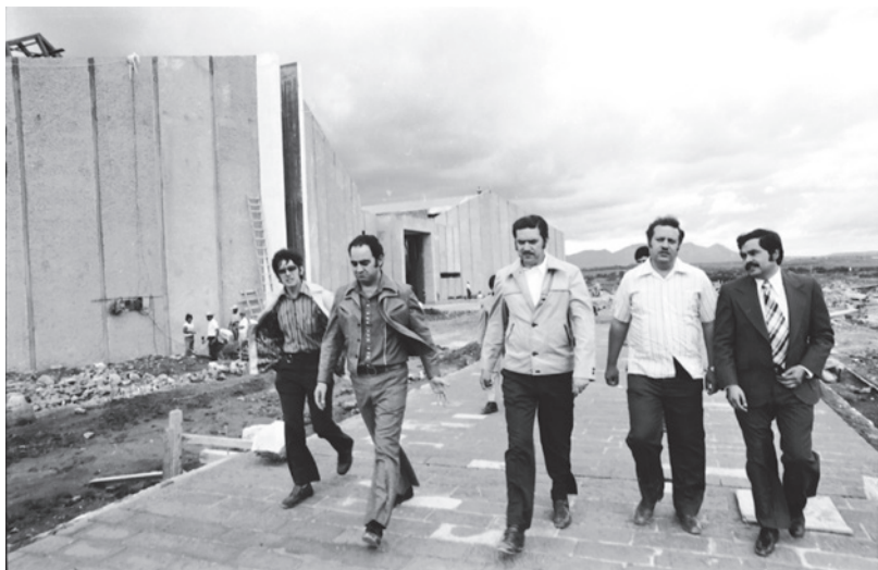
Fotografía 001.01.18. Recorrido.