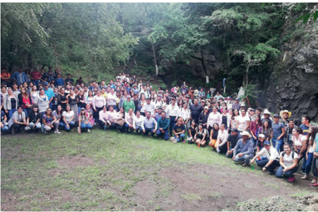
Imagen 1. Convivencia de profesores y estudiantes de la Facultad del Hábitat, Guadalcázar, San Luis Potosí