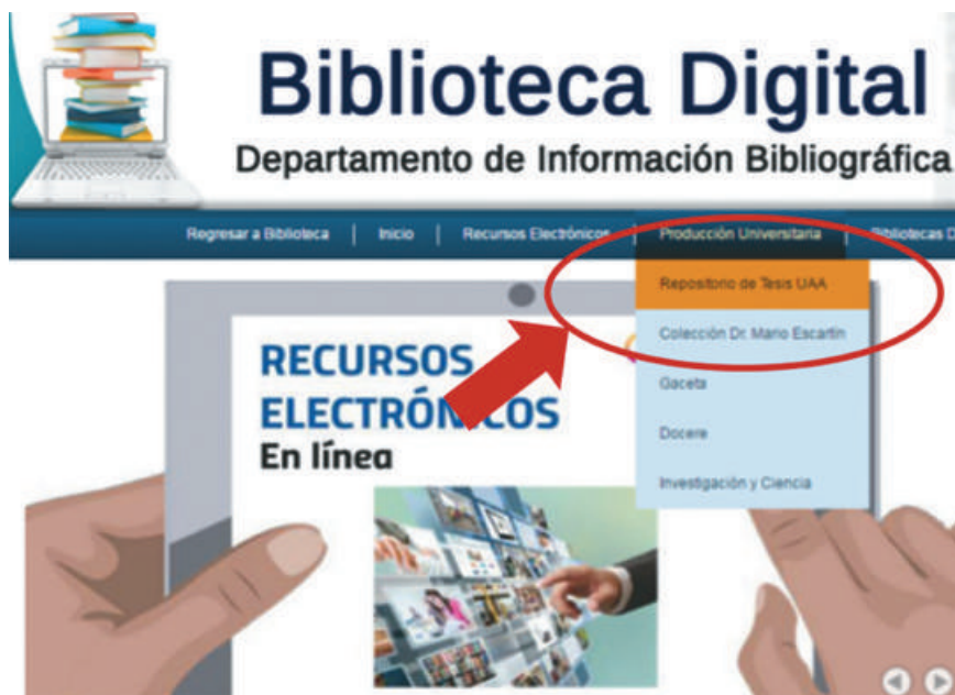
Imagen 1. Captura de pantalla de acceso al repositorio de tesis UAA.

Asimismo, es muy conveniente promover una cultura que privilegie acciones para compartir los documentos y materiales que elaboramos como profesores e investigadores, además de tener respeto por la autoría, ya que así como consultamos y aprovechamos lo que hacen colegas nacionales e internacionales –sin restricción alguna–, no perdamos la oportunidad de explorar los repositorios propios y los de otras instituciones, pero ante todo, pongamos a disposición las producciones de la UAA, haciéndolas visibles en beneficio de tareas de investigación y del ejercicio cotidiano de la docencia para todos.