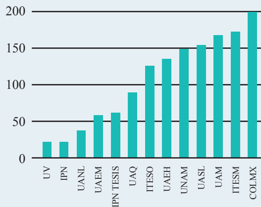
Gráfica 1. Posición de repositorios de instituciones mexicanas en el contexto latinoamericano.