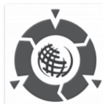
Wikipedia Art logo, February 2009

Wikipedia Art is a conceptual art work composed on Wikipedia , and is thus art that anyone can edit. It manifests as a standard page on Wikipedia – entitled Wikipedia Art . Like all Wikipedia entries, anyone can alter this page as long as their alterations meet Wikipedia's standards of quality and verifiability. [1] As a consequence of such collaborative and consensus-driven edits to the page, Wikipedia Art , itself, changes over time.