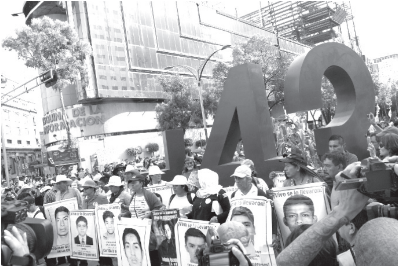
Figura 4. Fotografía de protesta en la Ciudad de México por los 10 meses de la desaparición de los normalistas de Ayotzinapa. 21