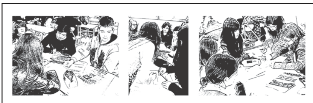
Imagen 2. Aplicación del instrumento. Colegio Henry Dunant.

Se hicieron pequeños grupos de cuatro y seis niños, ellos tenían que escribir la descripción de las fotografías indicadas en el material dado y después explicarla verbalmente. Las instrucciones fueron las siguientes: “Vean y describan las fotografías indicadas, después hagan agrupaciones por algún parecido que encuentren en ellas y asignen nombres a sus grupos”.