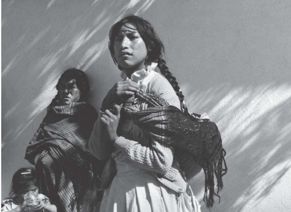
Imagen 4. Fotografía inserta en un álbum familiar.

Mariana Yampolsky, Mujeres mazahuas (1989). San Agustín Metepec, Estado de México.