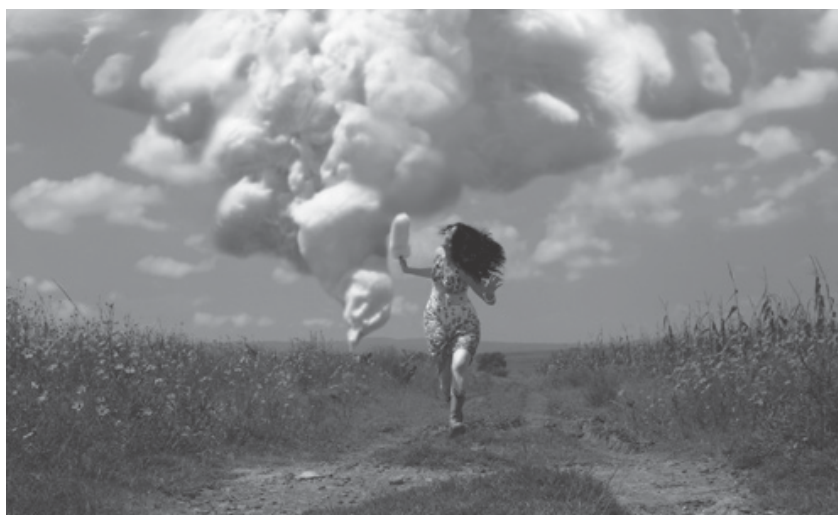
Imagen 1. Fotografía mostrada a los niños. Daniela Edburg, Muerte por algodón de azúcar , 2006.

Una diferencia significativa fue la reacción ante una imagen versión de “La última cena”, realizada por el fotógrafo argentino Marcos López (“Asado en Mendiolaza”, 2001); los niños describieron todos los elementos de la imagen: “es una comida de amigos que festejan algo, comen un siervo o cerdo, beben vino, jugo y refrescos, tienen copas y vasos, hay ensalada también, están sentados alrededor de una mesa...”, y de pronto, un niño explicó: “es como una imagen religiosa, la de la cena”. Otro niño asintió con la cabeza y subrayó: “es verdad, hicieron una copia de esa imagen, sólo que es afuera y en la tarde...”, y un silencio se hizo. Sólo tres niños sabían a qué imagen se referían, los otros dijeron nunca haberla visto, pues en su casa no tenían referentes religiosos y, por lo visto, tampoco pictóricos.