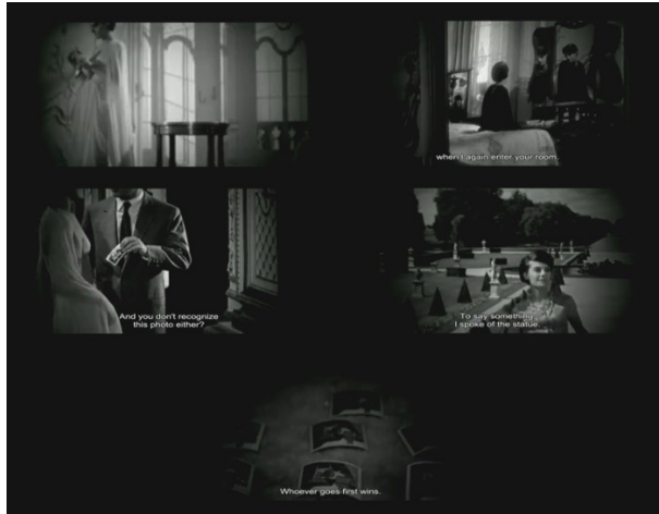
Figura 3. Tercer elemento: memoria y olvido. El extranjero (el fugitivo) intenta convencer a la mujer de cómo se conocieron el año pasado en Marienbad. Los recuerdos a los que hace alusión siempre son diferentes, se repiten aleatoriamente. La fotografía sin embargo es la misma y descubre un cajón llena de las mismas instantáneas justo antes de que su asesino entre. Vuelve a olvidar.

La multiplicación de las fotografías y la disparidad en los recuerdos del encuentro entre el hombre y la mujer nos llevan al cuarto elemento de yuxtaposición y repetición: El juego. En el hotel, entre las caminatas pasando por los mismos pasillos infinitos del hotel barroco, con la misma iluminación, pero con diferencias sutiles nos encontramos con los salones de juego. Tal como los recuerdos en el pozo de la memoria de la mujer se van intercambiando para salir emergentes, así los juegos de azar se intercambian en la película. Por eso volvemos al mismo lugar una y otra vez, pero por distintos caminos. Para poder comprender qué es lo que está pasando dentro del relato entramos en una especie de delirio en el que los recuerdos, la fotografía, los