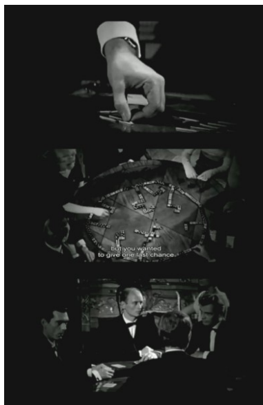
Figura 4. Cuarto elemento: los juegos de azar. Los que podemos observar a lo largo del cortometraje serán: la cartas, el dominó y el Nim.

Los elementos referidos para el análisis de L'année dernière à Marienbad apuntan hacia un cine que reflexiona sobre el propio cine. En la forma en la que constantemente nos sumerge en las tinieblas tratando de escapar del espacio como alguien que quiere ensayar saltar fuera de su propia sombra. Con su relación con las artes, en la presentación de la fotografía como testigo de algo que, no obstante, se ha querido olvidar pero se encuentra como testigo irrefutable de su condición ontológica. Con la pintura como aquella cualidad de la imagen que realiza una estética de la aparición, que no está en el mundo y que sin embargo crea su propia realidad. Con la representación teatral dentro de la presentación fílmica de la imagen en movimiento. Con la ilusión del cine como movimiento natural y como presentación de la desilusión al trasgredir la experiencia que nace