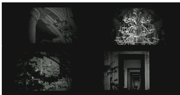
Figura 1. Primer elemento: espacios apenas iluminados con descripción de objetos y de formas. La numeración de éstos se repite a lo largo del largometraje.

derecha a izquierda con la numeración de objetos de ese espacio laberíntico en el que nos encontramos desorientados en el espacio del espectador. Los dos espacios, tanto el profilmico como el del espectador, han sido transgredidos desde el principio. El primero por la oscuridad del encuadre y el segundo por la multiplicación del espectador dentro del filme. Entre los planos secuencia ocho y nueve del primer plano de un pasillo con sus estatuas volvemos a la oscuridad y a la persistencia de la voz en la enumeración de objetos del hotel.