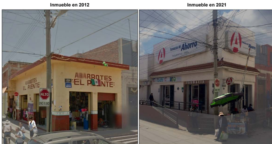
Figura 3. Transmisiones observables. Elaboración propia basado en google maps street view.

comunicar ambas partes de la ciudad, oriente y poniente. Dicho puente era de piedra y al no haber automóviles en la ciudad fue un hito urbano. Así, la tienda no solo rescató el valor urbano-arquitectónico por su ubicación, sino también por su nombre, ya que refuerza la identidad de los habitantes con su ciudad y el comportamiento de la misma. Actualmente, en el predio de la tienda “el puente” existe una “farmacia del ahorro”, evidencia de la destrucción no solo arquitectónica, sino también identitaria, producto del cambio ideológico que repercute en la ciudad. Esta erosión de valores e identidades se representa en la figura 3.