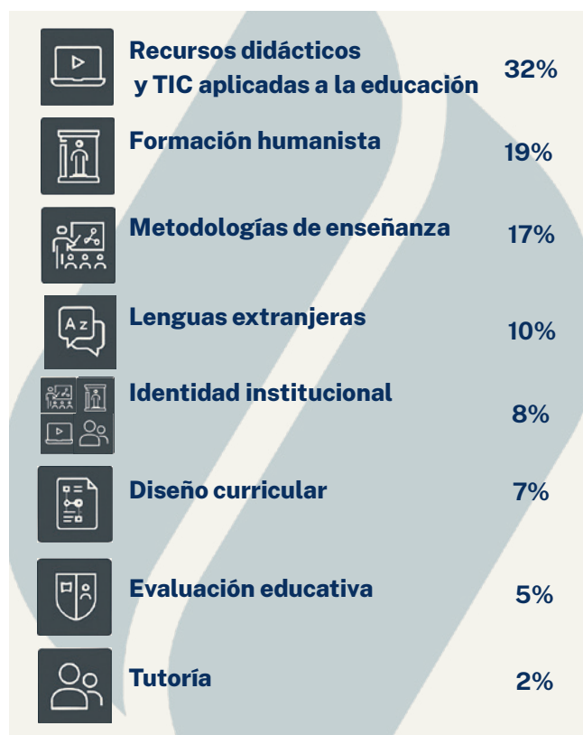
Imagen 1. Porcentaje de cursos impartidos durante el trienio 2023-2025, por área de formación docente

La impartición de cursos comprende el servicio principal del DEFAA. Para ello, este departamento establece una oferta para cada uno de los cuatro periodos del año. Ésta deriva del diagnóstico de necesidades anual sobre las tendencias educativas en materia de formación docente de los ámbitos internacional, nacional y local, así como de las necesidades manifestadas por la comunidad docente, a través de la consulta de opinión que se despliega durante el proceso de inscripción a cursos. En la oferta se consideran las necesidades de formación docente dadas a conocer por las áreas académicas y administrativas de la institución. En el trienio 2023-2025, se ofertaron 187 cursos distintos, vinculados a las ocho áreas de formación docente antes referidas, como se observa en la Imagen 1.